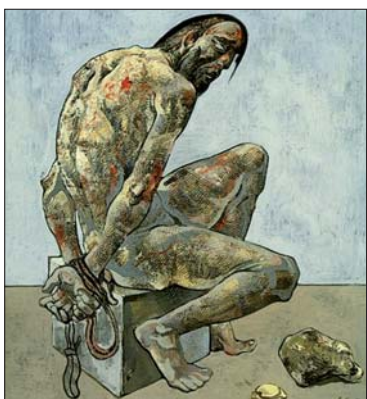
• Rolf Maria Koller, Geißelung, 1922, Öl auf Leinwand, oil on canvas, NS-DOK.

Ort: Luxor, Luxemburger Straße 40 Beginn: 20 Uhr (Einlass) Web: www.luxor-koeln.de