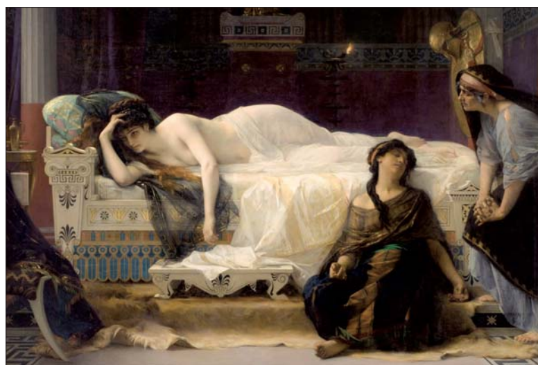
Alexandre Cabanel, Phädra, 1880, Öl auf Leinwand, oil on canvas, Musée Fabre, Montpellier.

The Wallraf Museum is presenting a new exhibition devoted to one of the most important salon painters from the 19 th century. In cooperation with the Musée Fabre in Montpellier in France, the museum is showcasing more than 60 paintings of Alexandre Cabanel, a man who was born as the son of a carpenter and later became court painter of Napoleon III. ◀