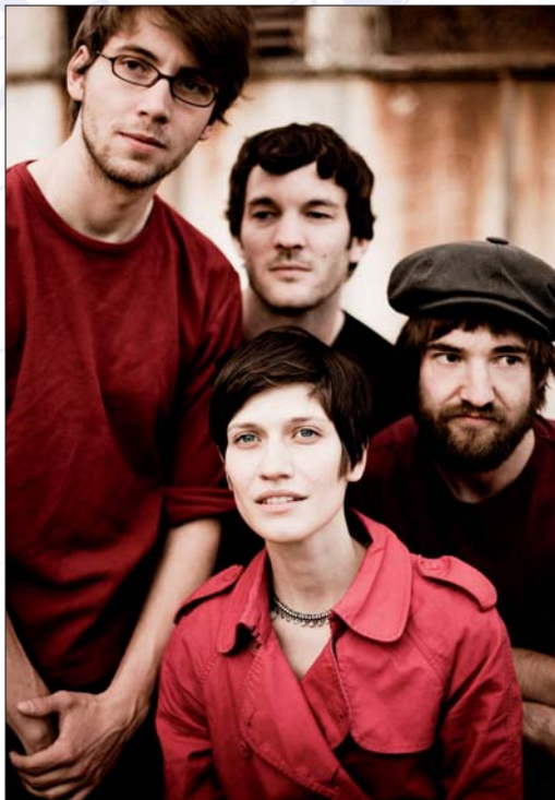
Alin Coen Band.

Ort: Wallraf-Richartz-Museum, Obenmarspforten Öffnungszeiten: 10 - 18 Uhr (Dienstag - Sonntag) Web: www.wallraf.museum