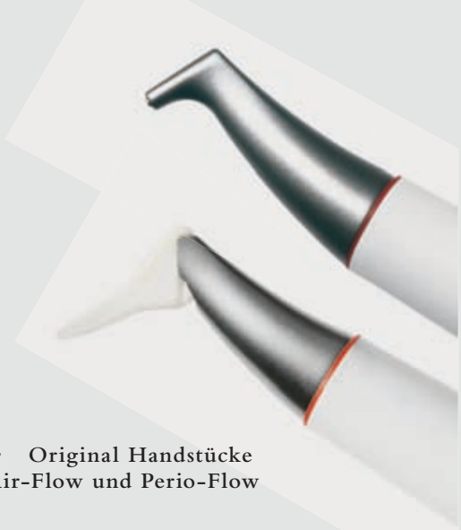
> Original Handstücke Air-Flow und Perio-Flow

Und wenn es um das klassische supragingivale Air-Polishing geht,