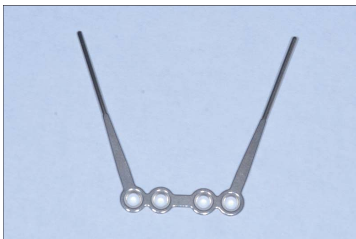
Abb. 1: Mentoplate (Fa. Promedia)

Ähnlich einer Eröffnung Olympischer Spiele wurden die am Kongress teilnehmenden Nationen in der feierlichen Zeremonie von den Organisatoren vorgestellt. Diese sehr warme wie herzliche Begrüßung zeigte, wie sehr der Wunsch nach einer Optimierung von kieferorthopädi-