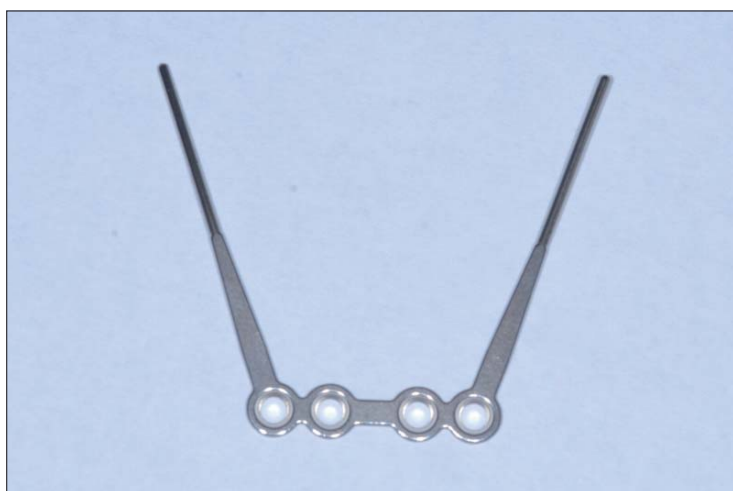
Abb. 1: Mentoplate (Fa. Promedia)