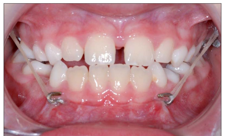
Abb. 3: Intraorale Situation mit intermaxillären Gummizügen. Das Tragen der unbeliebten Gesichtsmaske ist nicht mehr erforderlich, vielmehr wird eine 24-stündige Kraftapplikation bei relativ hohem Patientenkomfort ermöglicht.