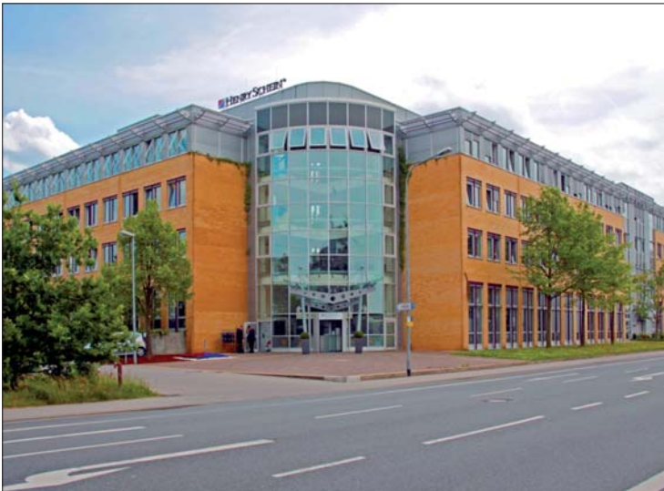
Henry Schein eröffnete neuen Hauptsitz für Dental Deutschland, Europa Dental und Shared Services Europa.

Hauptsitz von Henry Schein Dental Deutschland sowie die Europazentrale für Dental und Shared Services in Langen eingeweiht.