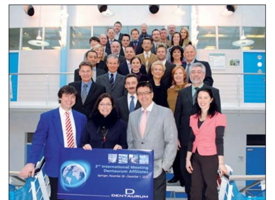
Gäste aus aller Welt trafen sich in Ispringen zum viertägigen Meeting.

gestatteten Villa auf. Die Schlaf- und das Badezimmer der Familie befanden sich im ersten Stock. Im Dachgeschoss des Hauses wohnten die Hausangestellten, wie es zur damaligen Zeit in einem großbürgerlichen Haushalt üblich war. Die Repräsentationsräume im Erdgeschoss der Villa sind mitsamt ihrem prunkvollen Interieur bis heute gut erhalten geblieben. Wie durch ein Wunder wurde die Villa Winkelstroeter im Zweiten Weltkrieg nicht zerstört, während die angrenzende Dentaforum-Produktionsstätte komplett verwüstet wurde. Von der Tür-