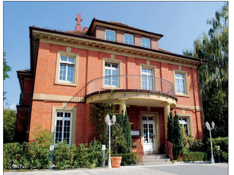
„La Villa“ – die ehemalige Villa Winkelstroeter.

Internationales Töchertreffen der Dentaforum-Gruppe.