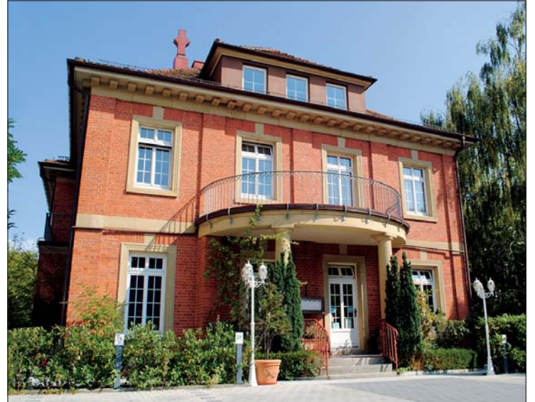
„La Villa“ – die ehemalige Villa Winkelstroeter.

Internationales Töchertreffen der Dentaforum-Gruppe.