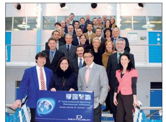
Gäste aus aller Welt trafen sich in Ispringen zum viertägigen Meeting.

gestatteten Villa auf. Die Schlaf- und das Badezimmer der Familie befanden sich im ersten Stock. Im Dachgeschoss des Hauses wohnten die Hausangestellten, wie es zur damaligen Zeit in einem großbürgerlichen Haushalt üblich war. Die Repräsentationsräume im Erdgeschoss der Villa sind mitsamt ihrem prunkvollen Interieur bis heute gut erhalten geblieben. Wie durch ein Wunder wurde die Villa Winkelstroeter im Zweiten Weltkrieg nicht zerstört, während die angrenzende Dentaforum-Produktionsstätte komplett verwüstet wurde. Von der Tür-