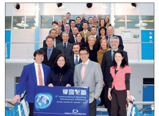
Gäste aus aller Welt trafen sich in Ispringen zum viertägigen Meeting.

gestatteten Villa auf. Die Schlaf- und das Badezimmer der Familie befanden sich im ersten Stock. Im Dachgeschoss des Hauses wohnten die Hausangestellten, wie es zur damaligen Zeit in einem großbürgerlichen Haushalt üblich war. Die Repräsentationsräume im Erdgeschoss der Villa sind mitsamt ihrem prunkvollen Interieur bis heute gut erhalten geblieben. Wie durch ein Wunder wurde die Villa Winkelstroeter im Zweiten Weltkrieg nicht zerstört, während die angrenzende Dentaforum-Produktionsstätte komplett verwüstet wurde. Von der Tür-