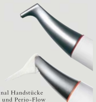
> Original Handstücke Air-Flow und Perio-Flow

Und wenn es um das klassische supra-gingivale Air-Polishing geht,