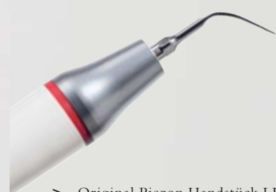
> Original Piezon Handstück LED mit EMS Swiss Instrument PS

Praktisch keine Schmerzen für den Patienten und maximale Schonung des oralen Epitheliums – grösster Patientenkomfort ist das überzeugende Plus der Original Methode Piezon, neuester Stand. Zudem punktet sie mit einzigartig glatten Zahnoberflächen. Alles zusammen ist das Ergebnis von linearen, parallel zum Zahn verlaufenden Schwingungen der Original EMS Swiss Instruments in harmonischer Abstimmung mit dem neuen Original Piezon Handstück LED.