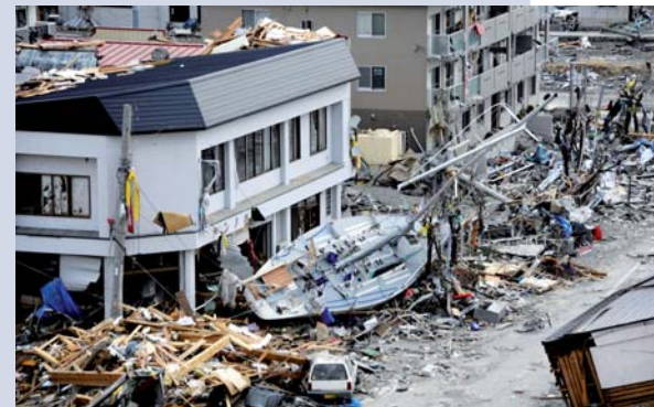
Trümmer im Fischereihafen von Ofonato, 15. März 2011.

„Diese verheerende Naturkatastrophe mit all ihren noch nicht absehbaren Folgen für Mensch und Umwelt hat globale Ausmaße angenommen. Sie macht uns erneut deutlich, dass die Natur keine Grenzen kennt. Das Mindeste, das wir in dieser Situation