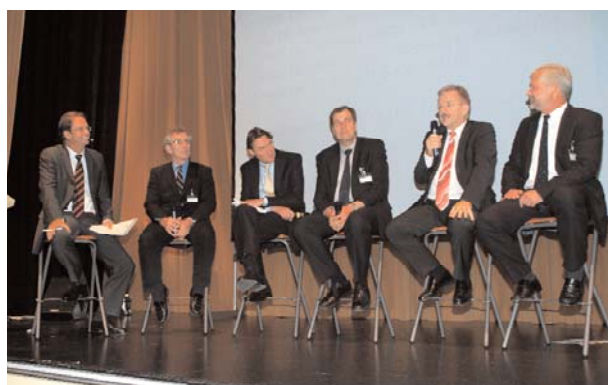
Renommierte Referenten aus Deutschland und der Schweiz standen beim Jubiläumskongress im vergangenen Jahr den Teilnehmern bei der Podiumsdiskussion Rede und Antwort.

Neben einer Vielzahl Workshops und Hands-on-Kursen bietet die traditionelle Podiumsdiskussion – in diesem Jahr zur Frage „Digitale Implantologie – was soll, was muss“ – viele Möglichkeiten zum Erfahrungsaustausch zwischen Referenten und Teilnehmer. Der kollegiale Austausch, verbunden mit dem ein oder anderen Tipp, ist im IDS-Jahr, wenn Herstel-