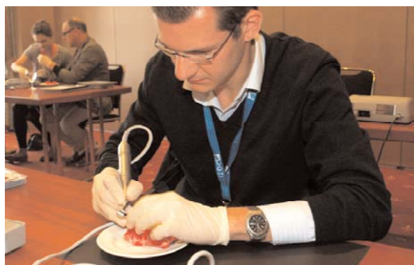
Implantologie praxisnah – in Workshops können die Teilnehmer neue Techniken und Produkte testen.