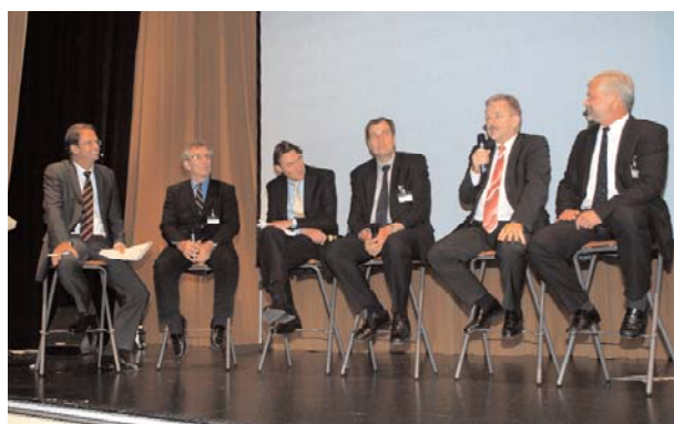
Renommierte Referenten aus Deutschland und der Schweiz standen beim Jubiläumskongress im vergangenen Jahr den Teilnehmern bei der Podiumsdiskussion Rede und Antwort.

Neben einer Vielzahl Workshops und Hands-on-Kursen bietet die traditionelle Podiumsdiskussion – in diesem Jahr zur Frage „Digitale Implantologie – was soll, was muss“ – viele Möglichkeiten zum Erfahrungsaustausch zwischen Referenten und Teilnehmer. Der kollegiale Austausch, verbunden mit dem ein oder anderen Tipp, ist im IDS-Jahr, wenn Herstel-