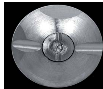
Encode Healing Abutment.