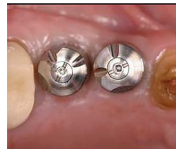
Eingeheilte Encode Healing Abutments.