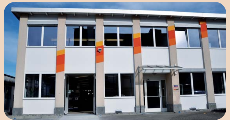
Das neue M+W-Betriebsgebäude in Illnau-Effretikon.

dass nicht im Katalog aufgeführte Produkte beschafft werden. Insgesamt kümmern sich 204 Mitarbeiterinnen und Mitarbei-