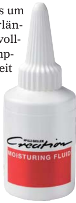
Das Moisturing Fluid ist mit allen Keramikmassen kompatibel.

nicht so schnell aus und wird durch das Fluid plastischer bzw. modellierbarer und lässt sich dadurch auch gezielter applizieren – für mehr Effizienz und Präzision beim Schichten! Bei der Brandführung ist darauf zu achten, dass die Vortrocknungs- und die Verschlusszeit jeweils um eine Minute verlängert wird, um ein vollständiges Verdampfen der Flüssigkeit zu garantieren. Das neue Moisturing Fluid von Creation zur Regulierung des Feuchtigkeitsgehalts von Keramikmassen ist ab sofort in einem Fläschchen mit 25 Milliliter erhältlich. ZT