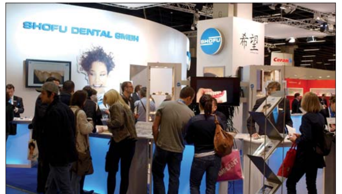
Der SHOFU-Messestand war stets gut besucht.