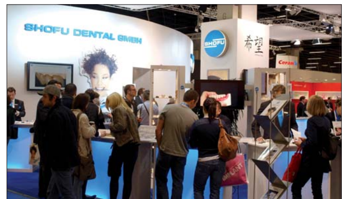
Der SHOFU-Messestand war stets gut besucht.