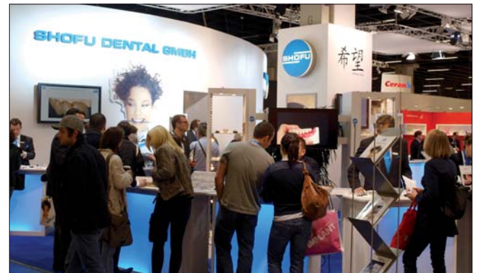
Der SHOFU-Messestand war stets gut besucht.