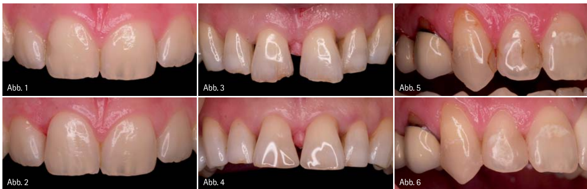
Abb. 1: Fall 1 – Die 19-jährige Patientin war mit dem ästhetischen Erscheinungsbild der Frontzahnfüllung Regio 11 unzufrieden. – Abb. 2: Fall 1 – Nach Präparation, Exkavation und Schichtung der Füllung mit G-ænial und anschließender Politur konnte ein hoch ästhetisches Ergebnis erzielt werden. – Abb. 3: Fall 2 – Der 59-jährige Patient war mit dem Aussehen seiner mittleren Oberkiefer-Frontzähne nicht mehr zufrieden. – Abb. 4: Fall 2 – Nach der Kompositfüllung mit einem hoch ästhetischen Material war der Patient mit dem Ergebnis sehr zufrieden. – Abb. 5: Fall 3 – Stark verfärbte und insuffiziente Frontzahnfüllungen der Zähne 13, 12. – Abb. 6: Fall 3 – Höchst ästhetisches Ergebnis bei einem geringen und kostengünstigen Aufwand.

Wenn ein neues Produkt auf dem Markt eingeführt wird, dann warten viele Verbraucher erst ab, ob sich das Material in der Praxis bewährt. An das neue Kompositssystem G-ænial von GC waren die Erwartungen von Anfang an hoch – erst recht, weil es sich um die Weiterentwicklung des seit vielen Jahren klinisch bewährten Systems Gradia Direct handelt.