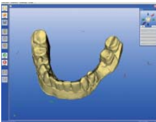
Abb. 1: Der intraorale Kamerascanner ermöglicht lichtsichtbare Ganzkiefer-Abformungen – Wegbereiter der abdruckfreien Praxis.

Den Impetus bezog diese Entwicklung aus zwei Quellen: Die Protagonisten der computergestützten Chairside-Versorgung wollten eine industriell hergestellte Keramik mit definierten physikalischen Eigenschaften unmittelbar an der Behandlungseinheit bearbeiten und den Patienten in einer Sitzung ohne Provisorium versorgen. Der andere Ansatz war, Oxidkeramiken – z.B. Zirkonoxid ( ZrO_2 ) – mithilfe der CAD/CAM-beziehungsweise digital gesteuerten Frästechnik für Kronen- und Brückengerüste nutzbar zu machen.