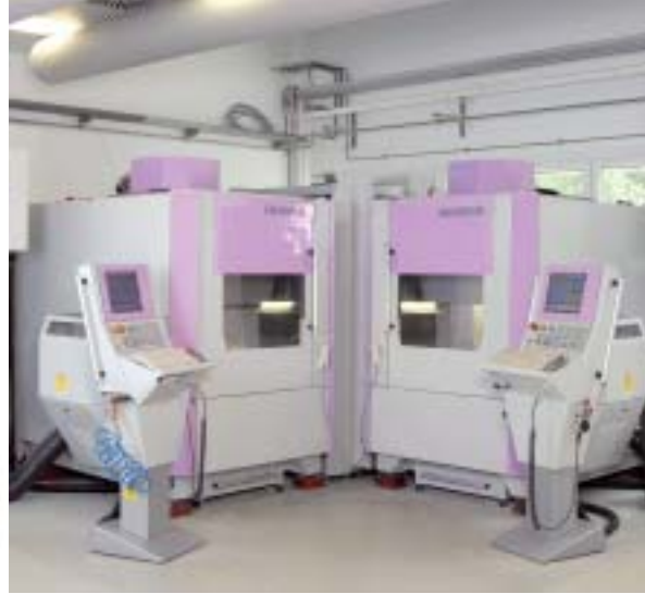
Abb. 3: Fräszentren sind auf standardisierte Fertigungsverfahren unter besonders wirtschaftlichen Gesichtspunkten eingestellt.

Auch andere Keramiken wie Lithiumdisilikat zeigten bessere Eigenschaften nach maschineller Bearbeitung, da die verwendeten Blanks industriell unter optimalen Bedingungen hergestellt werden. Auf der anderen Seite hat sich auch die Technologie der CAD/CAM-Systeme deutlich verbessert. Davon ausgehend, dass in den 1990er-Jahren Computer leistungsfähiger und Messverfahren effektiver wurden, konnten dadurch insbesondere 3-D-Aufnahmesysteme an die Bedürfnisse der Zahnmedizin angepasst und die Bedienung vereinfacht werden. Durch die Weiterentwicklung der CAD-Software wurden vielfältige Konstruktionsmöglichkeiten geschaffen (Abb. 1) und auch die Qualität der Schleif- und Fräseinheiten verbessert. Wirtschaftlichkeit bei gleichzeitig hoher Qualität der gefertigten Restaurationen sind aktuell die „Markenzeichen“ der CAD/CAM-Technik. Davon profitiert der Zahnarzt und Zahntechniker durch