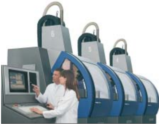
Abb. 2: Zur Bearbeitung von ZrO 2 -Keramik für Kronen- und Brückengerüste verfügen Fräszentren über eine ausgeklügelte Qualitätssicherung.