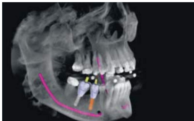
Abb. 5: DVT-Aufnahme mit überlagertem Suprastruktur zur Bestimmung der Implantatposition.