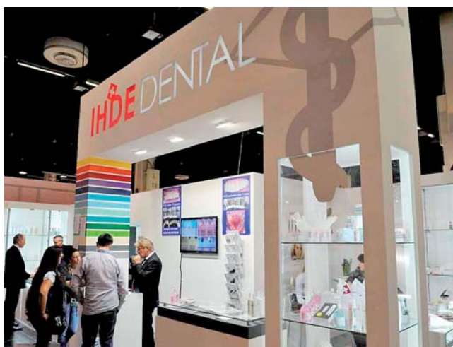
Ihde Dental präsentierte Produktpalette zur Desinfektion aller Bereiche.