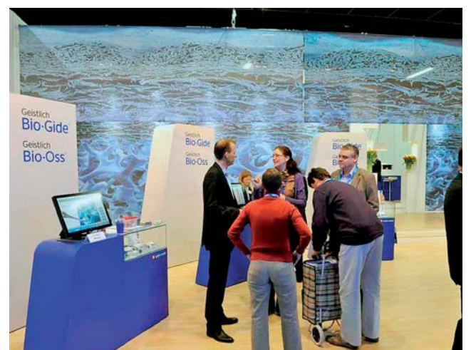
Die Extraktionsalveolen waren das Thema bei Geistlich Biomaterials.