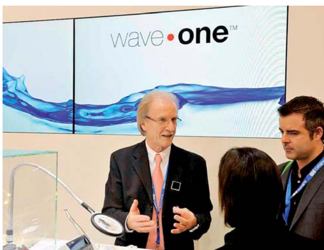
DENTSPLY Maillefer demonstrierte live „Wave one“, das neue Endo-System.