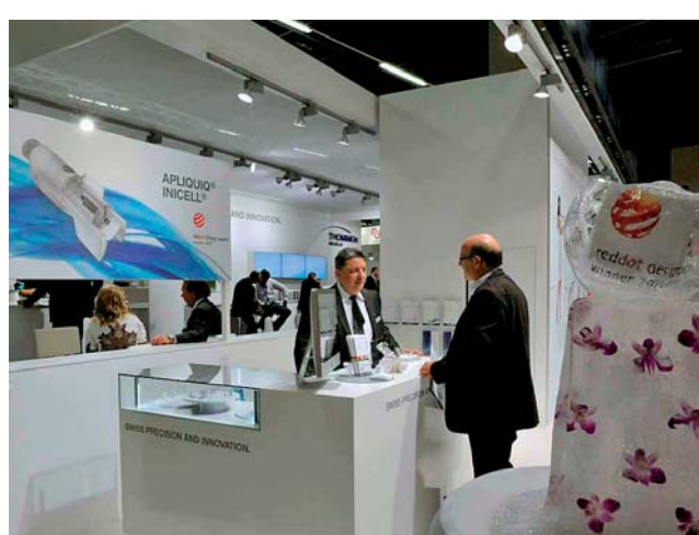
Thommen Medical verwöhnte die Gäste mit Musik und Molekularküche.