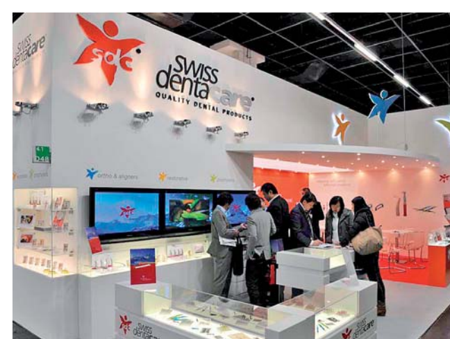
Swiss denta care, das neue Unternehmen präsentierte sich erstmals.