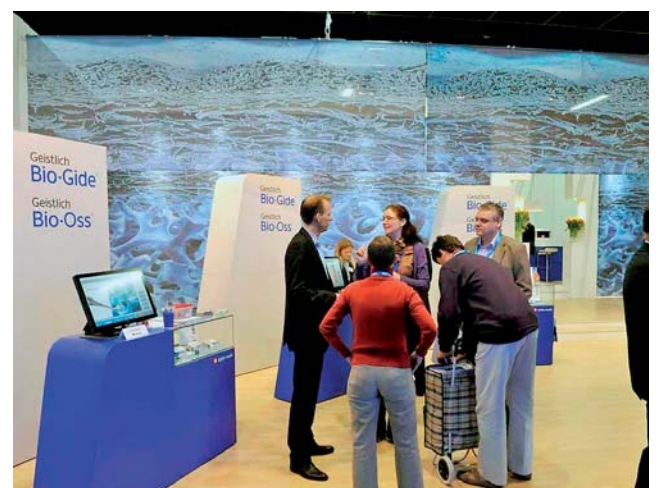
Die Extraktionsalveolen waren das Thema bei Geistlich Biomaterials.