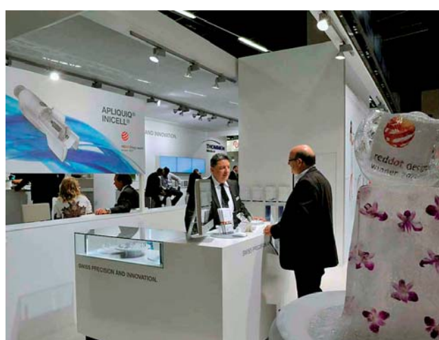
Thommen Medical verwöhnte die Gäste mit Musik und Molekularküche.