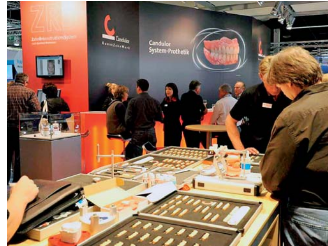
Zahntechniker und Zahnärzte informierten sich bei Candolor.