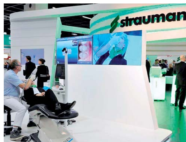
Straumann – ein Publikumsmagnet. Präsentierte die gesamte Produktlinie.