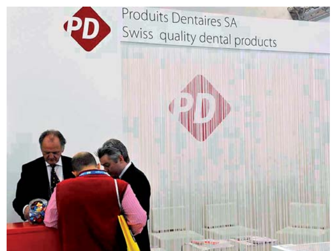
Produits Dentaires. Produkte für Endo, Restaurationen, Hygiene, Medical.