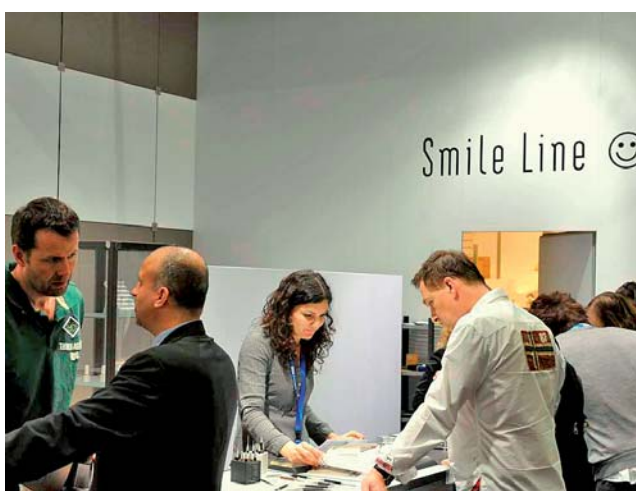
Eleganter Auftritt, edle Instrumente für das Labor von Smile Line.