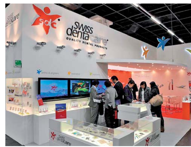
Swiss denta care, das neue Unternehmen präsentierte sich erstmals.