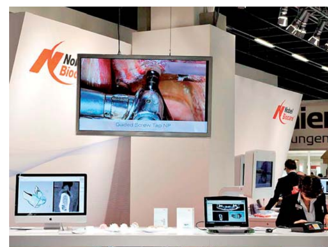
Nobel Biocare mit interaktivem Messeauftritt. Vorträge und Live-Demos.