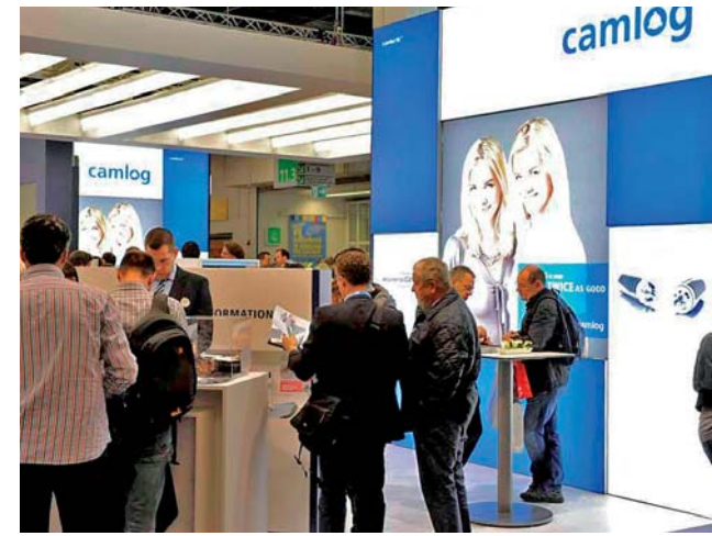
Die „Zwillinge“ Camlog und Conelog im Mittelpunkt der Präsentation.

Bildergalerie in der E-Paper-Version der Dental Tribune Swiss Edition unter: www.zwp-online.ch/publikationen