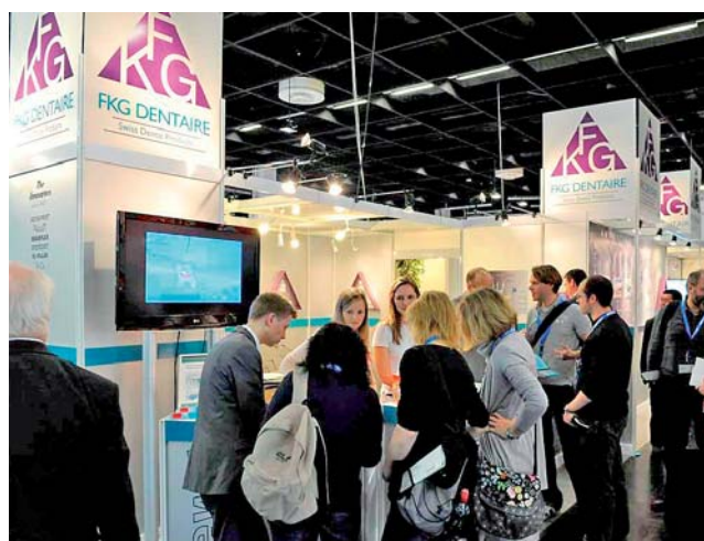
FKG Dentaire, der Endospezialist mit grösserem Stand und viel Publikum