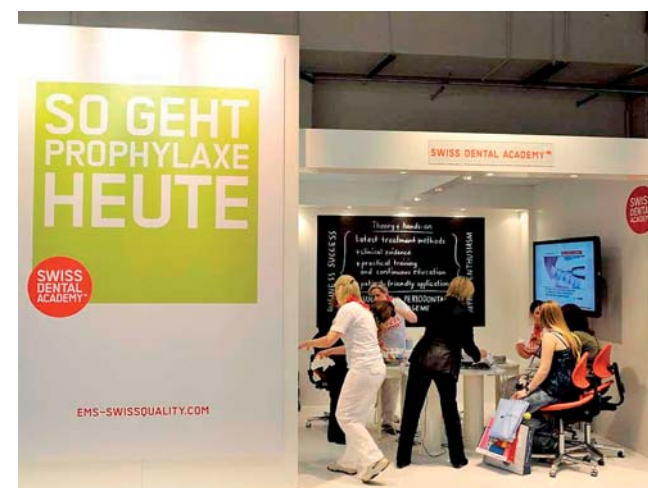
30 Jahre EMS und Swiss Dental Academy für professionelle Zahnreinigung.