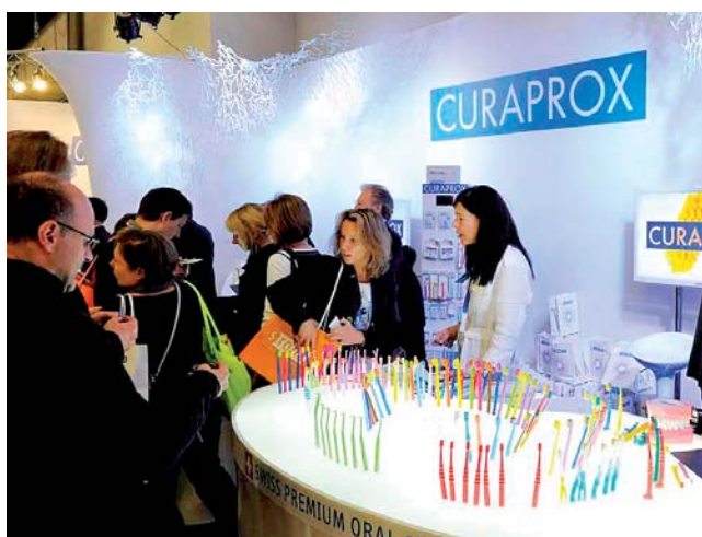
Prophylaxe im Zentrum. Curaprox mit breitem Sortiment erfolgreich.