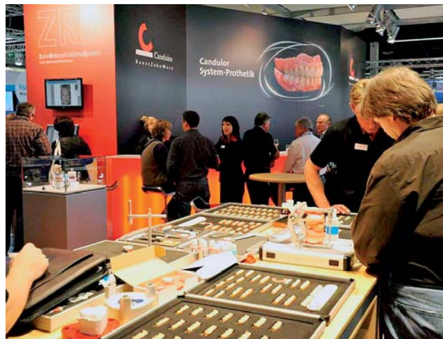
Zahntechniker und Zahnärzte informierten sich bei Candolor.