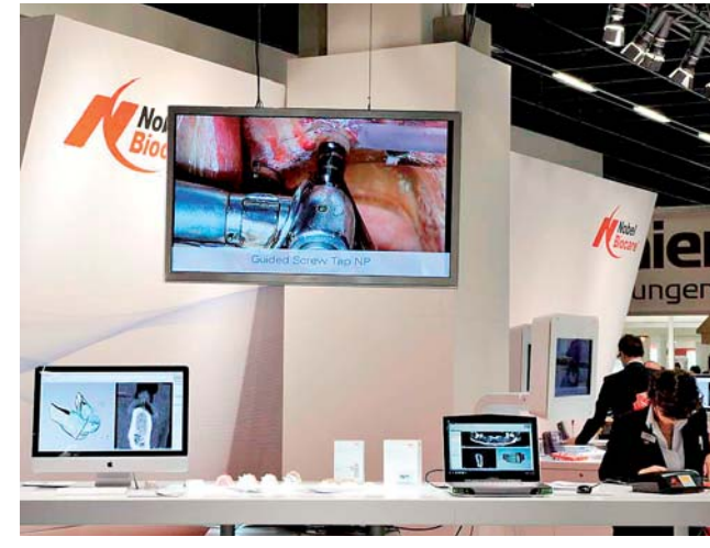
Nobel Biocare mit interaktivem Messeauftritt. Vorträge und Live-Demos.