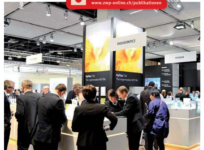
Am Stand von Coltene/Whaledent mit Live-Demonstrationen.