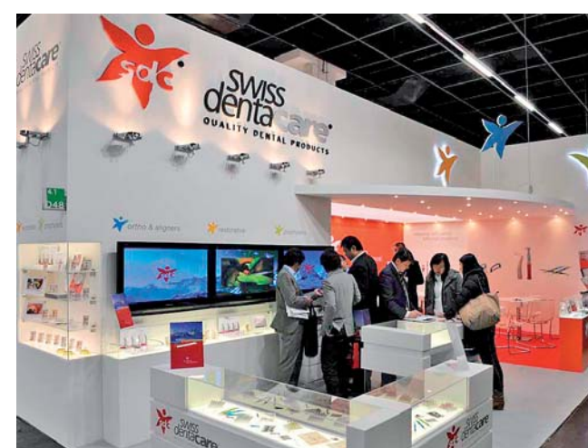
Swiss denta care, das neue Unternehmen präsentierte sich erstmals.