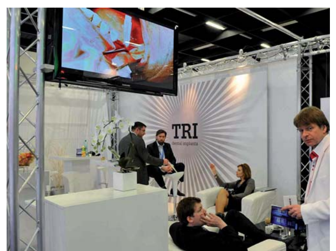
TRI Dental Implants, ein neuer Implantatanbieter aus der Schweiz.