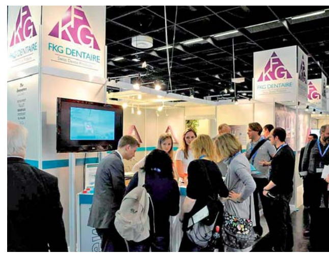
FKG Dentaire, der Endospezialist mit grösserem Stand und viel Publikum