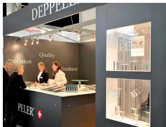
Deppele-Instrumente aus der Schweiz international präsentiert.