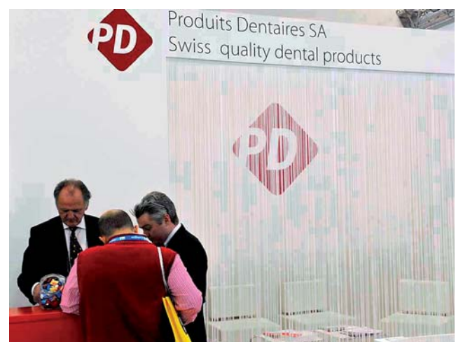
Produits Dentaires. Produkte für Endo, Restaurationen, Hygiene, Medical.