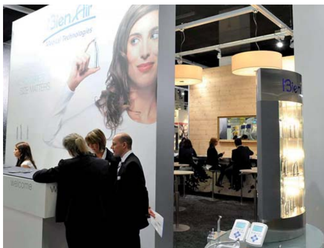
Dental- und Laborsparte von Bien Air mit ästhetischem Auftritt.

Gegenüber Dental Tribune äusseren die Schweizer positiv über die Resonanz zu Zahnärzten, Zahn Technikern