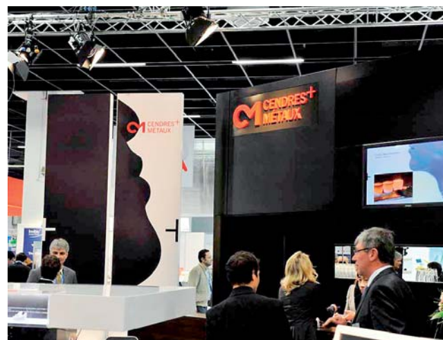
Live-Demonstrationen und Video-Show bei Cendres+Métaux.