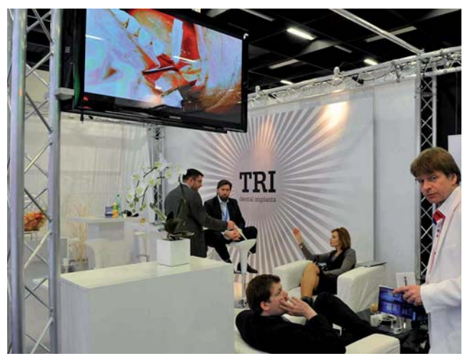
TRI Dental Implants, ein neuer Implantatanbieter aus der Schweiz.