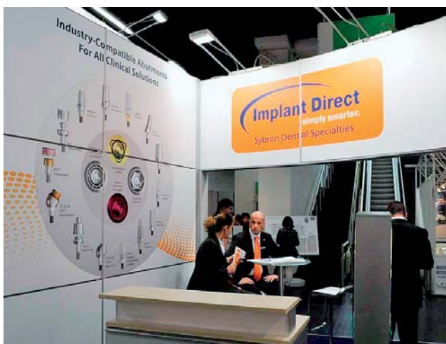
Implant Direct, der Online-Anbieter für Produkte zur Dentalimplantologie.