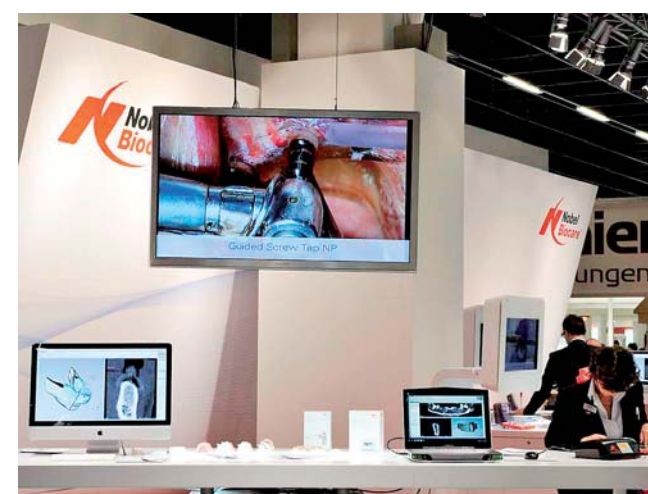
Nobel Biocare mit interaktivem Messeauftritt. Vorträge und Live-Demos.