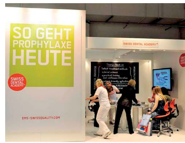
30 Jahre EMS und Swiss Dental Academy für professionelle Zahnreinigung.