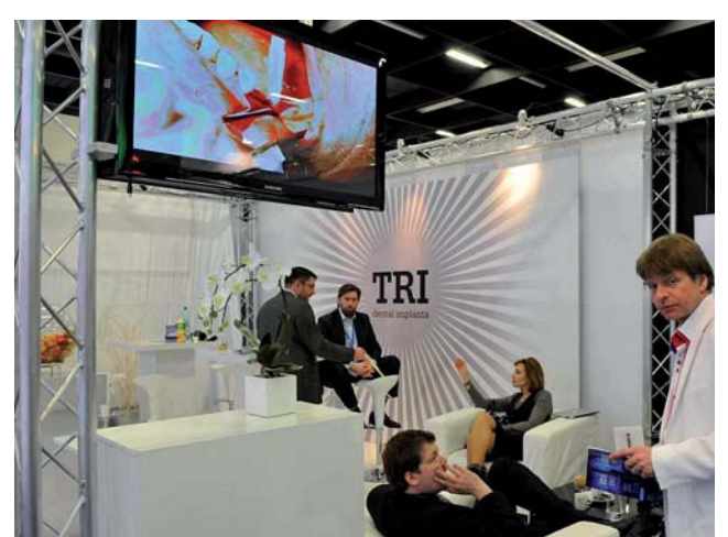
TRI Dental Implants, ein neuer Implantatanbieter aus der Schweiz.