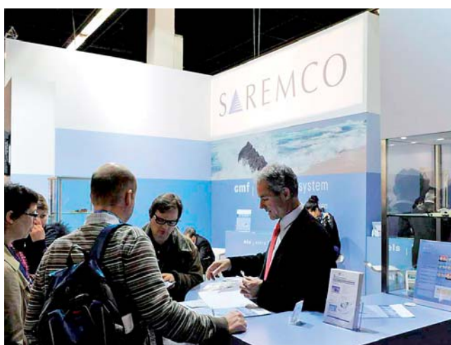
Saremco mit 30 Jahren Erfahrung in der restaurativen Zahnheilkunde.