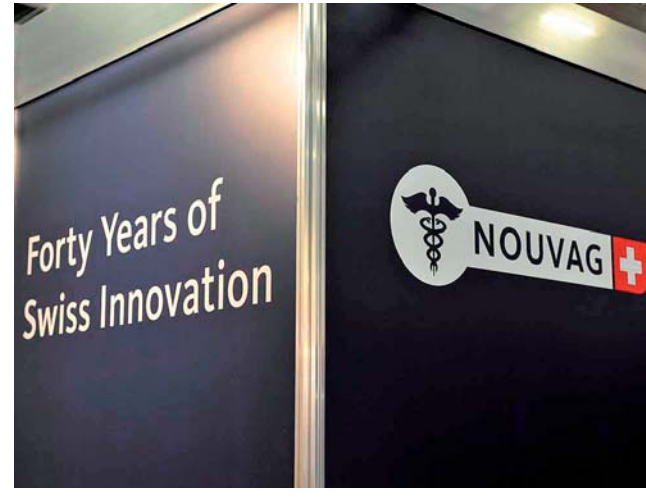
40 Jahre Nouvag. Präsentierte neue Motorsysteme für Chirurgie und Endo.