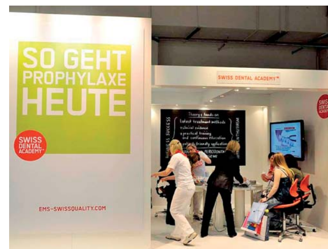
30 Jahre EMS und Swiss Dental Academy für professionelle Zahnreinigung.