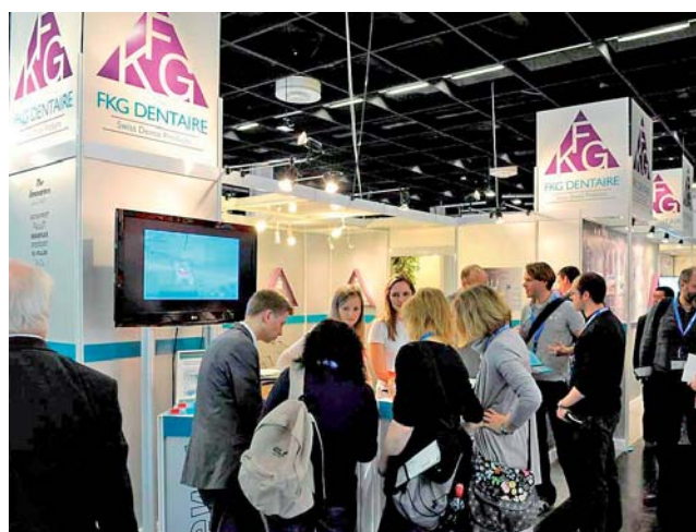
FKG Dentaire, der Endospezialist mit grösserem Stand und viel Publikum