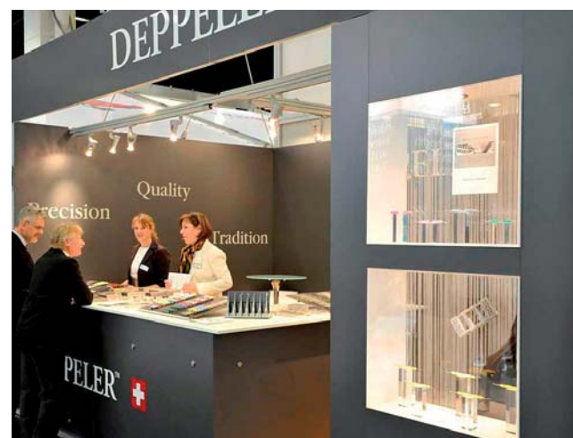
Deppele-Instrumente aus der Schweiz international präsentiert.