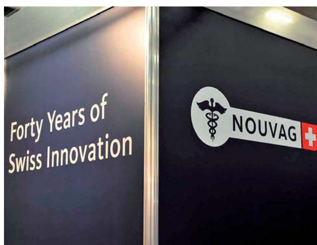
40 Jahre Nouvag. Präsentierte neue Motorsysteme für Chirurgie und Endo.