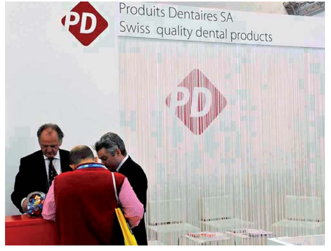
Produits Dentaires. Produkte für Endo, Restaurationen, Hygiene, Medical.