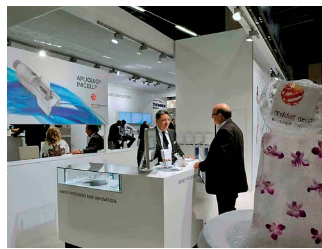
Thommen Medical verwöhnte die Gäste mit Musik und Molekularküche.