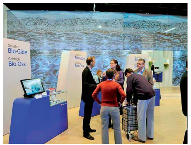
Die Extraktionsalveolen waren das Thema bei Geistlich Biomaterials.