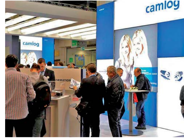
Die „Zwillinge“ Camlog und Conelog im Mittelpunkt der Präsentation.

Bildergalerie in der E-Paper-Version der Dental Tribune Swiss Edition unter: www.zwp-online.ch/publikationen