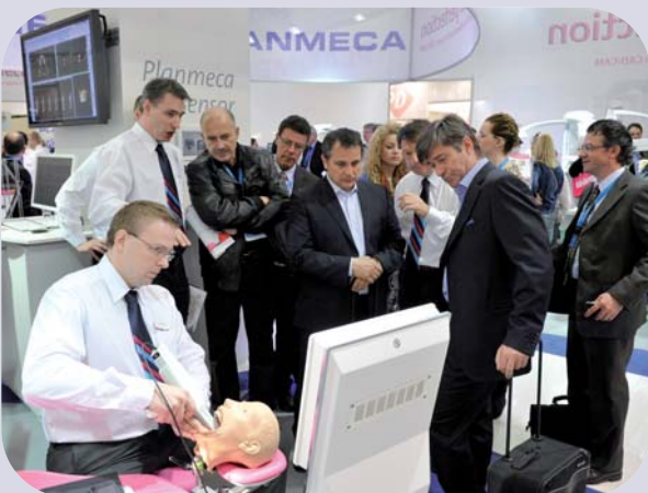
Demonstration bei Planmeca.

Schon Tradition hat die geführte IDS-Tour mit Kaladent. So kommt man zielgerichtet und ohne Umweg gleich an die gewünschten Stände und wird bevorzugt informiert. Ein Highlight war der Besuch bei Intensiv, dort gab es einen Diamanten zu gewinnen.