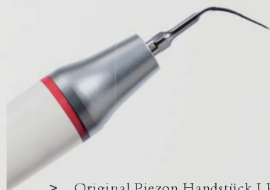
> Original Piezon Handstück LED mit EMS Swiss Instrument PS

Praktisch keine Schmerzen für den Patienten und maximale Schonung des oralen Epitheliums – grösster Patientenkomfort ist das überzeugende Plus der Original Methode Piezon, neuester Stand. Zudem punktet sie mit einzigartig glatten Zahnoberflächen. Alles zusammen ist das Ergebnis von linearen, parallel zum Zahn verlaufenden Schwingungen der Original EMS Swiss Instruments in harmonischer Abstimmung mit dem neuen Original Piezon Handstück LED.