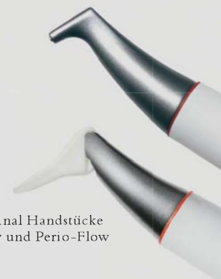
> Original Handstücke Air-Flow und Perio-Flow

Und wenn es um das klassische supra-gingivale Air-Polishing geht,