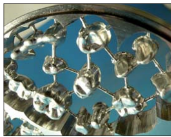
Sescoi ist sowohl in Erfurt als auch in Düsseldorf auf der Messe vertreten.

Zum achten Mal treffen sich Experten für Rapid-Technologien in Erfurt auf der Rapid.Tech vom 24. bis zum 25. Mai 2011, um sich über den aktuellen Stand und neue Trends generativer Fertigungsverfahren auszutauschen.