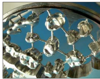
Sescoi ist sowohl in Erfurt als auch in Düsseldorf auf der Messe vertreten.

Zum achten Mal treffen sich Experten für Rapid-Technologien in Erfurt auf der Rapid.Tech vom 24. bis zum 25. Mai 2011, um sich über den aktuellen Stand und neue Trends generativer Fertigungsverfahren auszutauschen.