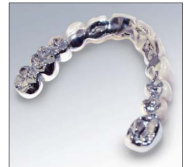
CAD/CAST ermöglicht Realisierung von CAD/CAST-Konstruktionen bei EM-Guss.

terial verwendet und gerüstnah abgetrennt. Und: Die Labore nutzen ihre Digitalscanner besser aus, da damit nun auch EM-Einheiten konstruiert werden können.