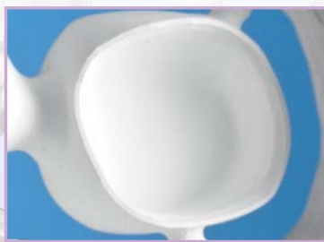
WorkNC Dental ® (saubere Präparationsgrenze)