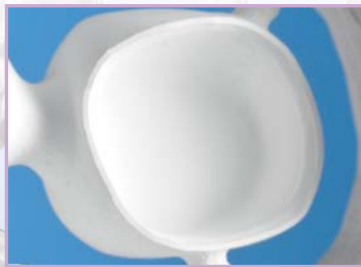
WorkNC Dental ® (saubere Präparationsgrenze)