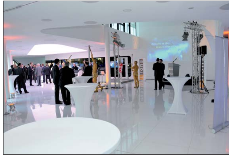
Das Ausstellungsfoyer des Sirona-Innovationszentrums ist mit allen technischen Raffinessen ausgestattet. Die Exponate repräsentieren unterschiedliche Technologien und zeigen, wie aus Visionen Innovationen entstehen.

Sirona weicht das neue Innovationszentrum ein.