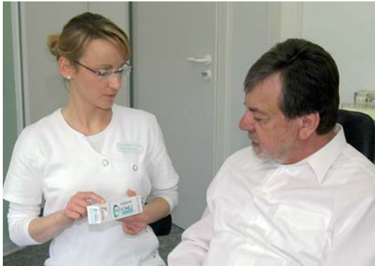
Abb 7: Erläutern sollten wir unseren Patienten ebenfalls, warum wir bei welchem (Erosions-)Befund welche Zahncreme empfehlen.