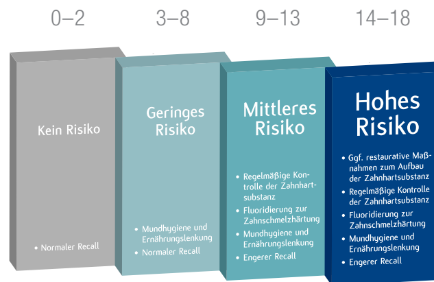
Abb 2: Ein neuer Index: der BEWE (Basic Erosive Wear Examination)-Index – Einfach (und) Gut.

recht gefährlich aus. Dass sie eine (ungefährliche) runde Spitze hat, sieht man auf den ersten Blick nicht. Aber wie kann ich, ohne auszufern, den Patienten erklären, was es mit dieser Messung auf sich hat? Eine sehr schöne Erklärung der Deutschen Gesellschaft für Parodontologie fand ich im Internet unter www.zahngesundheit-aktuell.de/psi : „Um das Zahnfleisch zu beurteilen, wird das Gebiss in sechs verschiedene Abschnitte eingeteilt. Jeder einzelne Bereich wird Zahn für Zahn mithilfe einer speziellen Sonde untersucht [...]: Vorsichtig führen wir die Sonde zwischen Zahn und Zahnfleisch ein und tasten behutsam um den gesamten Zahn. Dabei wird an bis zu sechs verschiedenen Stellen des Zahnes die (Sondierungs-)Tiefe, die Blutungsneigung des Zahnfleisches und die Rauigkeiten an der Zahnoberfläche gemessen. [...] Sie werden die