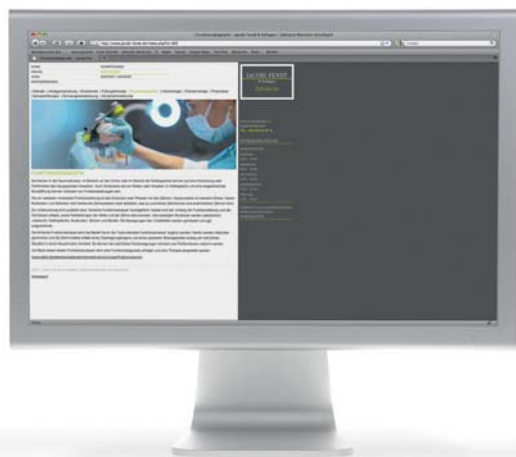
Gelungene Beispiele für ein mögliches ganzheitliches Corporate Design einer Zahnarztpraxis.