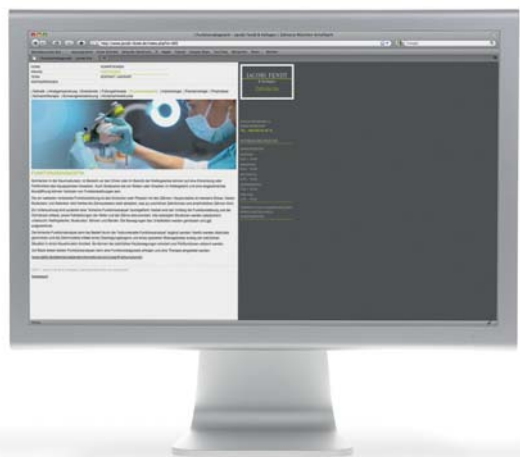
Gelungene Beispiele für ein mögliches ganzheitliches Corporate Design einer Zahnarztpraxis.

den Einladungskarten zieht sich das Corporate Design auch in der kompletten Geschäftsausstattung von „Jacobi Fendt & Kollegen“ konsequent durch. Zusammen mit praxiskom® wurden neben Briefpapier und Visitenkarten der behandelnden Ärztinnen auch Mappen für Heil- und Kostenpläne konzipiert. Durch die HKP-Mappen bekommt der Patient ein hochwertiges Printmedium an die Hand, womit er wiederum das Corporate Design nach Hause trägt und es verinnerlicht. Zusätzlich erstellte praxiskom® auch Praxisinformationsflyer und Leistungsflyer zu ausgewählten Behandlungen, die den Patienten nach Beratungsgesprächen als unterstützende Informationen mitgegeben werden. Ziel ist es, dem Patienten einen Einblick in die Arbeit der Zahnärztinnen zu verschaffen und die Behandlung für ihn möglichst transparent zu gestalten.