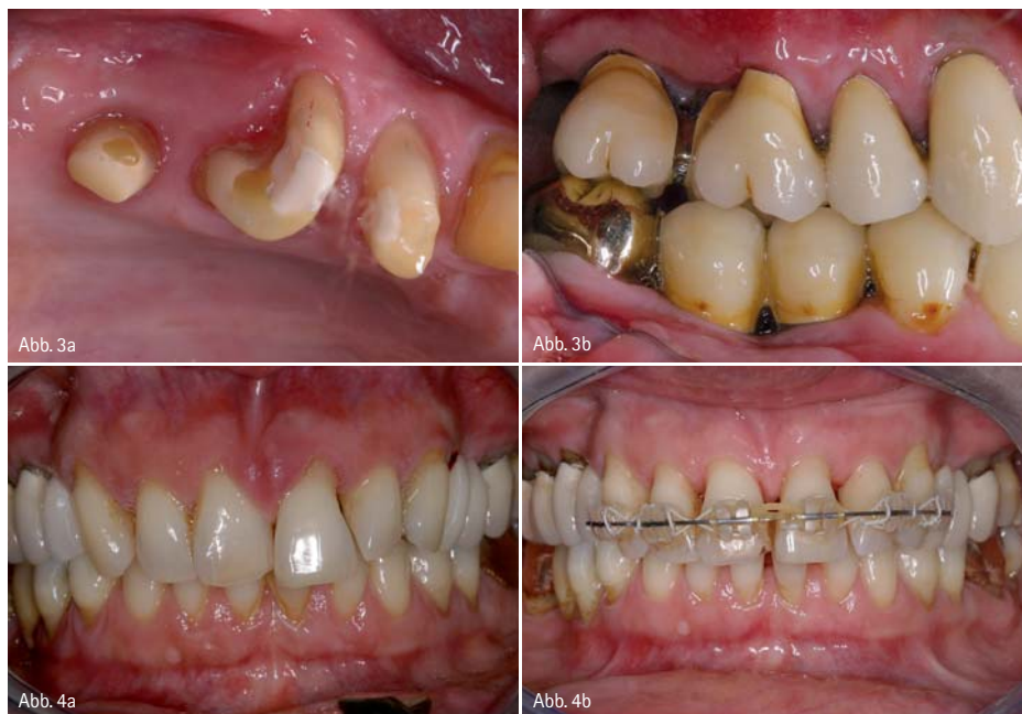
Abb. 3: a) Zahn 27 nach Amputation beider bukkaler Wurzeln, Zahn 26 nach Amputation der distobukkalen Wurzel nach Präparation. b) Eingegliederte Kronen. – Abb. 4: Kieferorthopädische Behandlung bei Zahnfehlstellung durch Parodontitis (nach Initialtherapie). Beachtenswert ist Zahn 21. a) Ausgangssituation. b) Eingegliederte kieferorthopädische Apparatur (siehe auch OPT Abb. 5).

Nach der allgemein üblichen konservativen Initialtherapie (Full Mouth Disinfection – in aggressiven und schweren chronischen Fällen mit Antibiose) sollte, falls dann noch notwendig, vor einer Exzision über mögliche parodontalchirurgische Interventionen nachgedacht werden. Abgesehen von regenerativen Maßnahmen stehen gerade bei persistierenden lokalen Parodontopathien resective Techniken zur Verfügung. Zur Behandlung des Furkationsbefalls im Molarenbereich setzen wir die Tunnelierung im Unterkiefer und im Oberkiefer die Wurzelamputation einer oder beider bukkaler Wurzeln ein (Abb. 3). Die Langzeitstudien zu diesen Verfahren 3, 5, 6, 7, 8, 9, 11, 14, 26, 28, 41 zeigen ebenso wie die Studien zur Tunnelierung 9, 19, 29 sehr unterschiedliche Ergebnisse. Bei unseren Patienten zeigte sich die Hemisektion im Unterkiefer als prognostisch ungünstig, da sich zum einen die exakte Definition einer Präparationsgrenze als problematisch erwies und zum anderen häufig Frakturen der