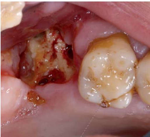
Abb. 1: Kiefernekrose in Regio 27 nach Zahnextraktion trotz plastischer Deckung und Antibiotikatherapie bei vorangegangener intravenöser Bisphosphonatgabe.