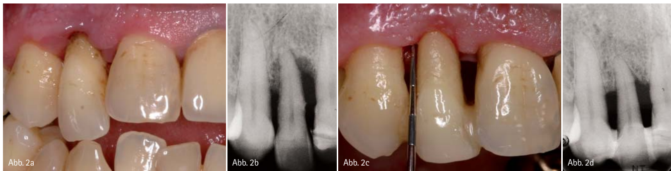
Abb. 2: Zahn 12. a und b) Ausgangssituation. c und d) Gekürzter und mit Komposit an den Nachbarzähnen geschienter Zahn 12 mit röntgenologisch sichtbarer Knochenregeneration nach Initial- und einjähriger Erhaltungstherapie.

von deutlich mehr als 50 Prozent können oft noch jahrelang in Funktion bleiben. Bei adäquater Erhaltungstherapie ist vielfach auch eine spontane Knochenregeneration in Fällen mit vertikalen Knochendefekten zu beobachten (Abb. 2). Ein wichtiges Entscheidungskriterium für oder gegen eine Exzision ist, ob eine geschlossene Zahnreihe vorliegt, in der kein Zahnersatz notwendig wäre, wenn alle Zähne erhalten werden könnten, oder ob es sich um ein Lückengebiss handelt, in dem ohnehin prothetische Maßnahmen angezeigt sind.