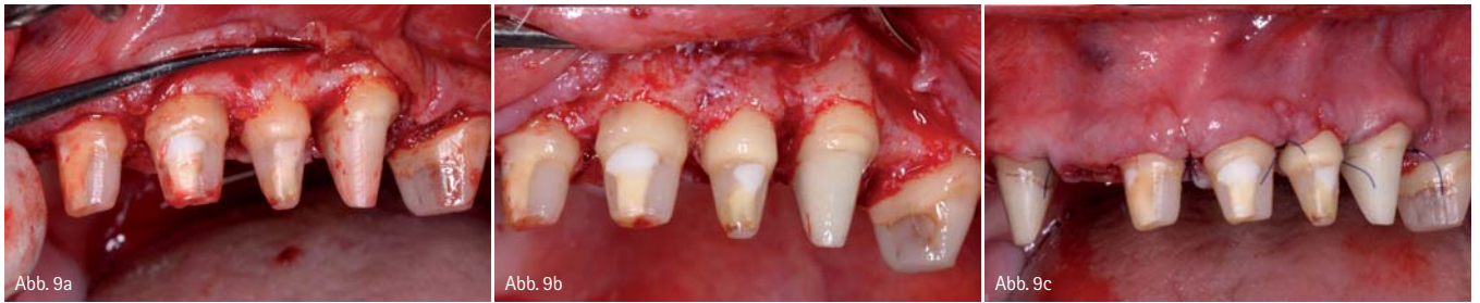
Abb. 9: Ferruleherstellung durch chirurgische Kronenverlängerung. a) Ausgangssituation nach Aufklappung. b) Nach Verlängerung mit zirkulärem Abstand von 3 mm der Präparationsgrenzen zum Knochen. c) Ansicht nach Nahtverschluss.

nal tooth", liegen die Prognosen circa zehn Prozent höher im Bereich von 88 bis 97 Prozent. 13 Bei Revisionen macht es einen großen Unterschied, ob eine Wurzelfüllung nur aus technischen Gründen erneuert wird (z.B. zu kurze Wurzelfüllung) (Erfolgsprognose 86 bis 98 Prozent), oder ob ein endodontisch behandelter Zahn mit apikaler Parodontitis behandelt werden muss (Erfolgsprognose 36 bis 77 Prozent). 4, 17, 31, 32, 40 Auch frakturierte Wurzelkanalinstrumente stellen keine Kontraindikation