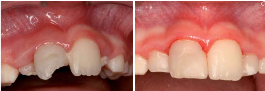
Abb. 8: Situation vor SAT-Versorgung (die Fistel ist verschwunden). – Abb. 9: Situation 16 Monate nach dem Unfall.

zen während der Induktion der Pulpablutung führten zu einem Wechsel der Behandlungsmethode. Diese sechs Zähne wurden mit einem apikalen MTA Stopp versorgt.