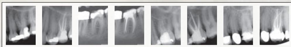
Fallbilder: Dr. Gilberto Debelian

elektrochemische Oberflächenbehandlung. Anders ist Bio-RaCe im Hinblick auf die ISO-Größen, Konizitäten und die Sequenz. Bio-RaCe wurde entwickelt, um den Wurzelkanal effizient und sicher mit wenigen Instrumenten aufzubereiten. Technik: BioRaCe sollten mit 500 bis 600 Upm bei 1 Ncm verwendet werden. ■