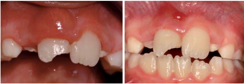
Abb. 6: Situation eine Woche nach dem Unfall. – Abb. 7: Situation zwei Wochen nach der Sterilisation, vor der SAT-Versorgung.