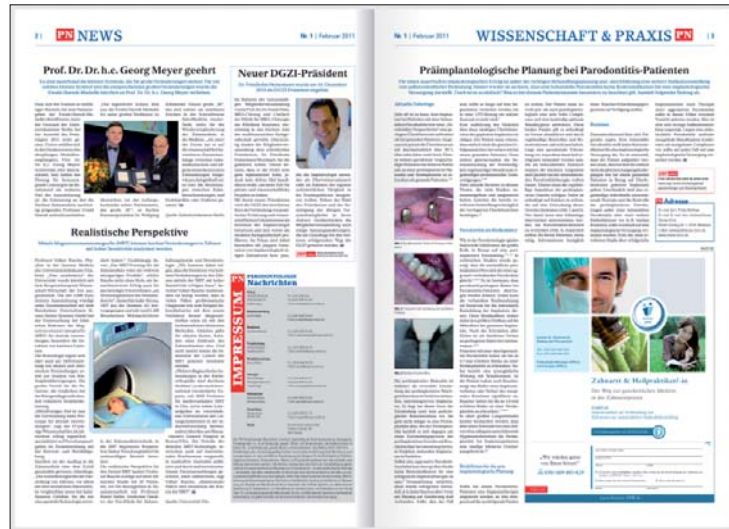
Die PN im E-Paper-Format unter www.zwp-online.info/publikationen

erweiterte jüngst dahingehend das Angebot. Mit der eigenen Verlags-App können alle Publikationen noch bequemer als