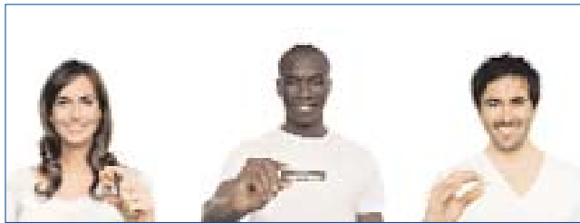
▲ Der VITA Lab Newsletter ist wahlweise für folgende drei Themenbereiche zu bestellen: „Verblendmaterial und Geräte“, „Zähne“ und „CAD/CAM und Geräte“.

Ab sofort werden up-to-date News rund um das Dentallabor nun direkt und zeitnah in das persönliche E-Mail-Postfach gesandt. Um in den Genuss dieses kostenfreien Services der VITA Zahnfabrik zu kommen, müssen Interessenten den neuen VITA Lab Newsletter online abonnieren. Dabei entscheiden die Leser, worüber sie informiert werden möchten. Denn der Newsletter ist wahlweise für folgende drei Themenbereiche zu bestellen: „Verblendmaterial und Geräte“, „Zähne“ und „CAD/CAM und Geräte“ – eine Mehrfachauswahl ist möglich.