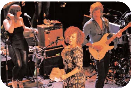
Mit ihrer Stimme begeisterte N’Dea Davenport das Publikum.