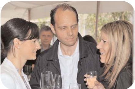
Die Gäste freuten sich auf das Konzert.