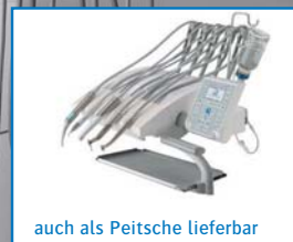
auch als Peitsche lieferbar