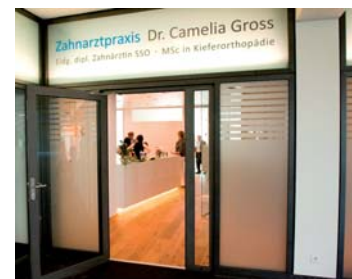
Der Eingang zur Praxis im Zentrum „Möwe“ Wetzikon.

Die Offerte für die neue Praxis wurde unterteilt in die Dentaleinrichtung und den Umbau, so konnte das Budgetlimit im Auge behalten werden. Funktionalität stand im Vordergrund. Auch sollten noch Raumreserven für eine Erweiterung mit einem dritten OP möglich sein. Aufgrund der Neuplanung konnte der Grundriss optimal an die Bedürfnisse abgestimmt