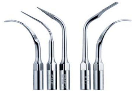
Original Swiss Instruments: Nur die Echten sind die Besten.