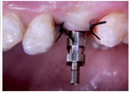
Abb. 4: Aufbau mit Zirkonnitridbeschichtung. – Abb. 5: Schnittführung und präparierte Knochenkavität. – Abb. 6: Abformpfosten nach Freilegung.