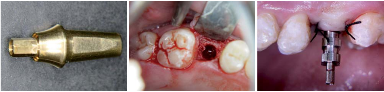
Abb. 4: Aufbau mit Zirkonnitridbeschichtung. – Abb. 5: Schnittführung und präparierte Knochenkavität. – Abb. 6: Abformpfosten nach Freilegung.