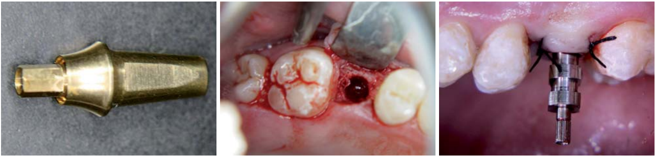
Abb. 4: Aufbau mit Zirkonnitridbeschichtung. – Abb. 5: Schnittführung und präparierte Knochenkavität. – Abb. 6: Abformpfosten nach Freilegung.