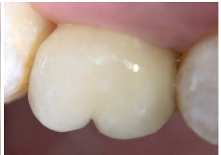
Abb. 7: Zustand nach internem Sinuslift und Implantation. – Abb. 8: Das Periotype X-Pert Implantat in finaler Position. – Abb. 9: Eingegliederte Krone.

heftung von Gingivafibroblasten zu einer besseren Voraussetzung für eine Periimplantitistherapie kommt. Nach Groessner-Schreiber wird die Bakterienanheftung durch die Beschichtung mit Zirkonnitrid signifikant reduziert (Groessner-Schreiber 2004).