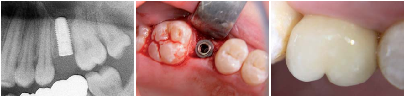
Abb. 7: Zustand nach internem Sinuslift und Implantation. – Abb. 8: Das Periotype X-Pert Implantat in finaler Position. – Abb. 9: Eingegliederte Krone.