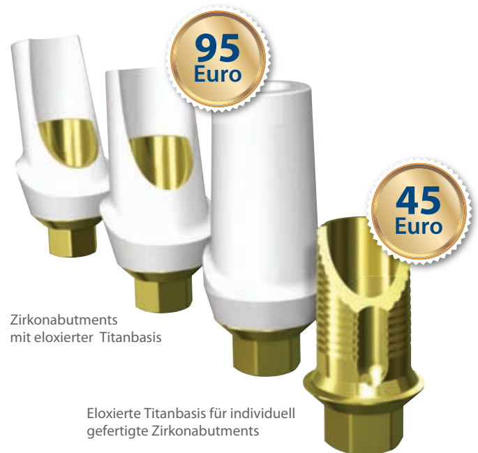
Zirkonabutments mit eloxierter Titanbasis