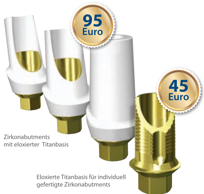
Zirkonabutments mit eloxierter Titanbasis