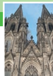
KÖLN 18./19. 11. 2011