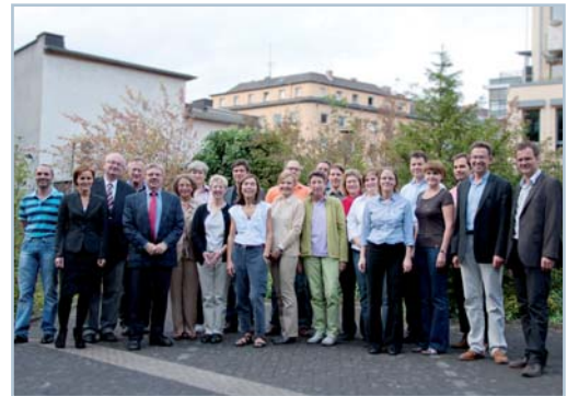
Der 6. Studiengang der Akademie am 23. September 2010 in der KZV Koblenz.