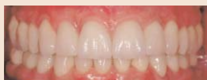
Je grösser ein Fall wird (bis hin zur Totalsanierung), desto mehr verwende ich im Seitenzahnbereich die VMK-Technik und im Frotzahnbereich die Voll- oder Zirkonoxidkeramik, da dies insbesondere im zervikalen Bereich für mich am besten händelbar ist. Bei devitalen Stümpfen oder Goldaufbauten mit geringem Platzangebot für die Verblendmasse gibt es nur die bewährte VMK-Technik.