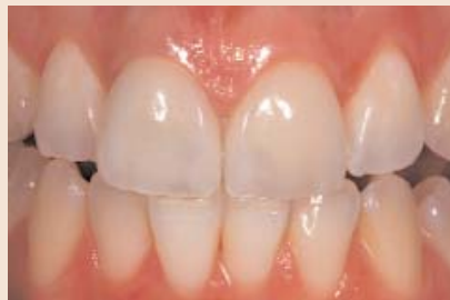
Die Entscheidung fiel auf Zirkonoxid. Die zervikal hohe Helligkeit und die schwarze Insel konnte mit einer 0,6er Kappe sowie Mi61 geblockt werden. Das Ergebnis der Zirkonoxidkrone (11) im Vergleich zum Veneer (21) ist gelungen.