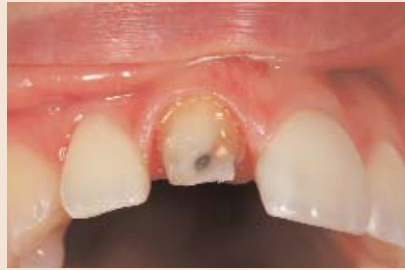
FALL 3 Die Ausgangssituation: Es bedarf zervikal einer hohen Helligkeit und einer inzisalen Blockung der deutlich zu sehenden schwarzen Verfärbung. Vorgehen mittels VMK-Technik oder Zirkonoxid?