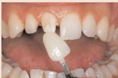
FALL 1 Hier bestand der Auftrag, für Zahn 12 ein Veneer und für Zahn 11 eine Krone zu erstellen.