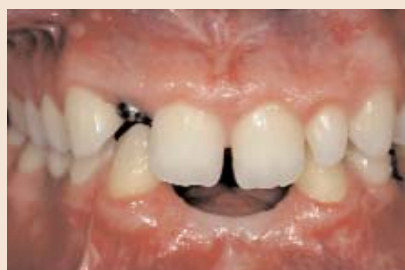
FALL 4 Der erste Eindruck ist hier sofort: Titanabutment/VMK-Technik, um genügend Stabilität zu erreichen. Dieser Fall fiel aber an der Universität Zürich in eine Zirkonoxidstudie, somit wurde ein Zirkonoxidkeramikabutment mit Aluminiumoxidkrone darauf hergestellt.