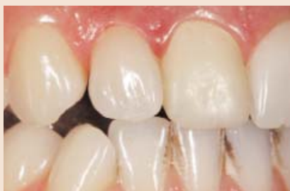
Oft – besonders bei sehr dünnen Veneers und mittel bis stark verfärbten Zahnstümpfen – kleben wir zuerst das Veneer, um eventuelle optische Veränderungen des Veneers nach dem Kleben berücksichtigen und in die Phase der Kronenherstellung mit einbeziehen zu können.