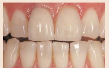
Zervikal hätte der Behandler am 11 subgingival noch tiefer präparieren können, um die distale Schattenzone besser zu kaschieren.