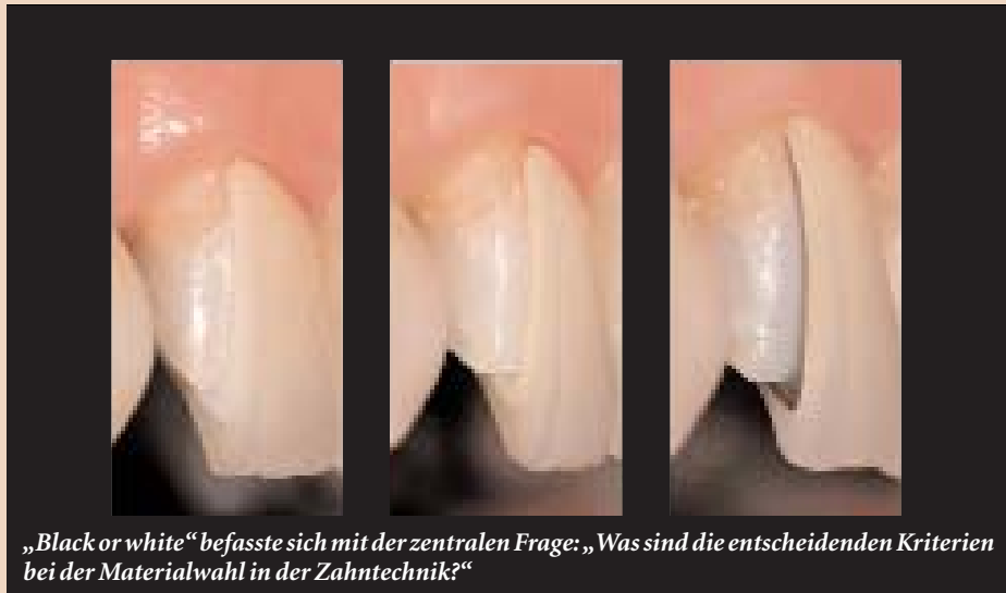
„Black or white“ befasste sich mit der zentralen Frage: „Was sind die entscheidenden Kriterien bei der Materialwahl in der Zahntechnik?“