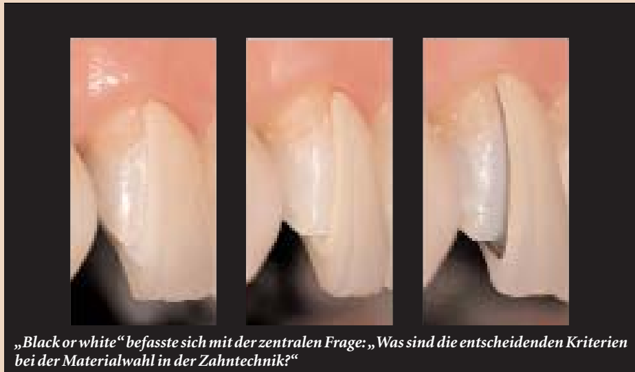
„Black or white“ befasste sich mit der zentralen Frage: „Was sind die entscheidenden Kriterien bei der Materialwahl in der Zahntechnik?“