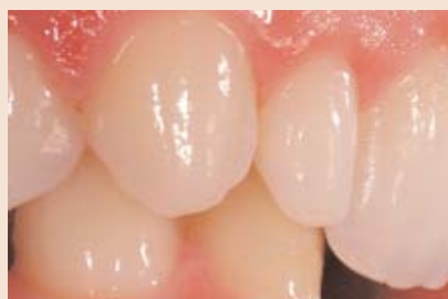
Es ist bekannt, dass die Mukose das Zirkonoxid aus biologischer Sicht liebt. Bei geringen Platzverhältnissen konnte in diesem Fall ein echter Erfolg erzielt werden. Die Arbeit ist bereits 4 Jahre in situ.