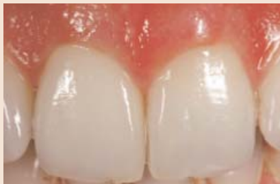
Bei hoher Helligkeit des natürlichen Zahnes arbeite ich sehr gerne mit der Zirkonoxidtechnik.