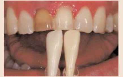
FALL 5 Gepresste Veneers oder geschichtete Veneers (auf Folie oder feuerfesten Stümpfen)?