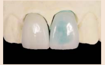
In diesem speziellen Fall wurden feuerfeste Creationveneers aufgrund der sehr geringen und unterschiedlichen Platzverhältnisse bevorzugt.