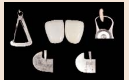
Grosser Spielraum im Aufbau: Von 0,01 mm bis hin zu 0,7 mm kann entschieden werden, in welcher Dicke und in welcher Verschiedenheit die Masse aufgetragen werden soll.