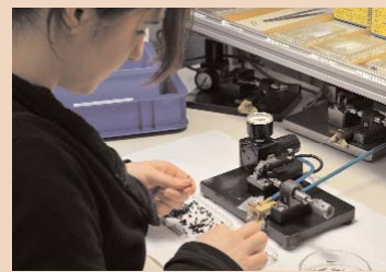
Das Innenleben einer Turbine entsteht.

tingleiterin mit einem Schmunzeln, „und heute auf der ganzen Fläche unsere Produkte“. Dahinter verbergen