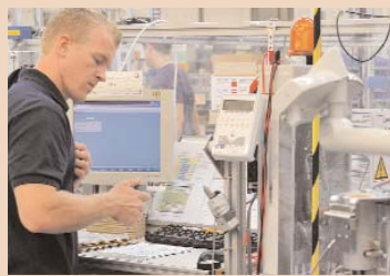
Die Prüfung auf elektrische Sicherheit ist eine von vielen nach jedem Montageschritt.

Im Hauptgebäude geht es in die oberste Etage. Hier präsentiert KaVo das komplette Programm: Von der