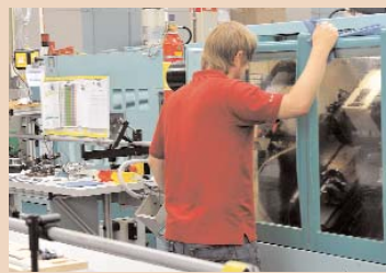
Modernste CNC-Automaten drehen die Teile für Turbinen.

Turbine bis zum DVT-Gerät. „Früher residierte hier auch noch die Geschäftsleitung“, berichtet die Marke-