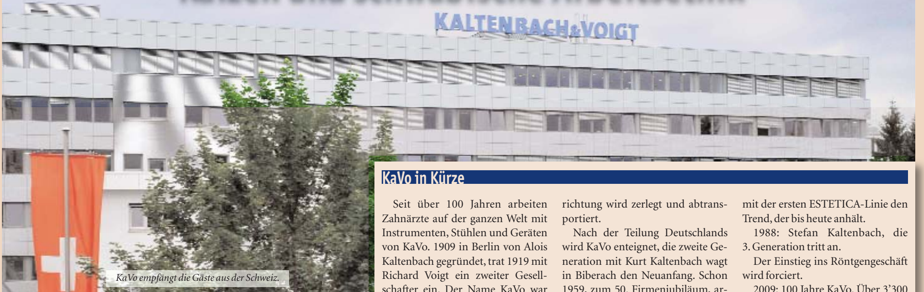
KaVo empfängt die Gäste aus der Schweiz.