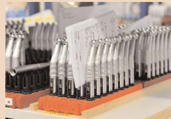
Jeder Montageschritt und jede Charge wird protokolliert.