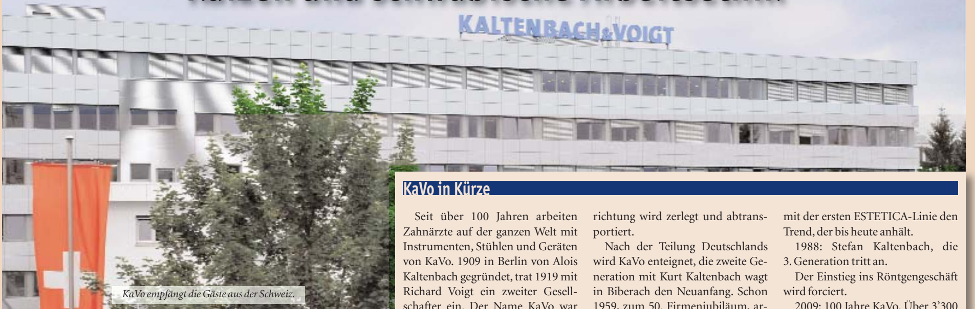
KaVo empfängt die Gäste aus der Schweiz.