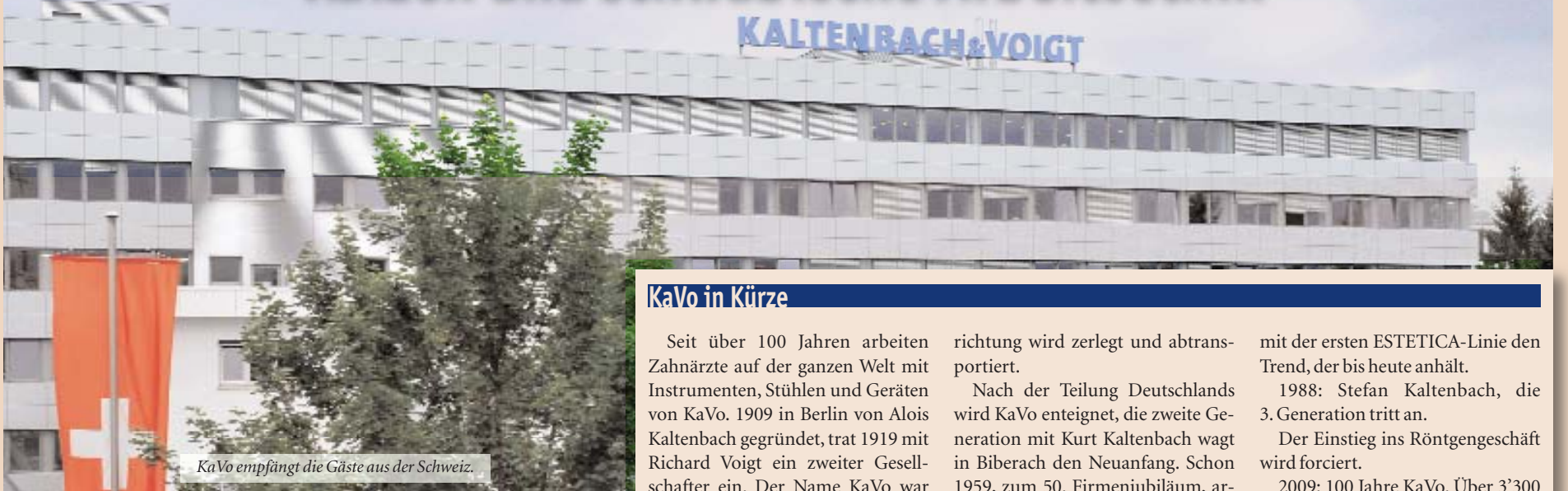
KaVo empfängt die Gäste aus der Schweiz.