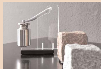
In der KaVo Erlebniswelt: Ein Spannzangengriff muss das Gewicht eines Pflastersteines halten.