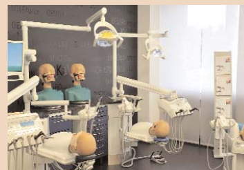
In der Ausstellung: Phantomarbeitsplätze für die Ausbildung.