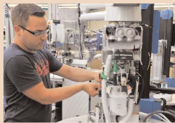
Die Einheiten werden nach dem Prinzip der Fließfertigung montiert.

„Blackbox“ zu greifen. Tatsächlich, man spürt den Unterschied: rau oder glatt, geriffelt oder gerippt. Oder der Spannzangengriff eines Winkelstückes hält das Gewicht eines Pflastersteines. Im Obergeschoss quälen Automaten eine Kopfstütze oder ziehen an den Schläuchen eines Schwingentisches. Multimediale Präsentationen veranschaulichen das Produkteprogramm und die Anwendung.