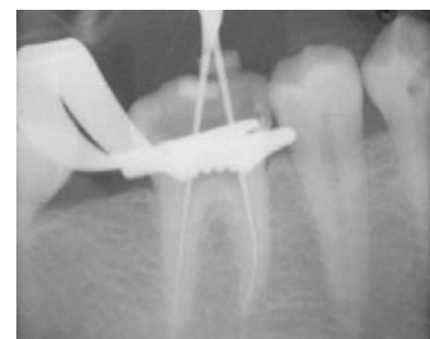
Abb. 2: Die Spitze SF65 bedient sich der Superelastizität von Nickel-Titan.

vorge stellt: die SF65. Mittels einer endodontischen Spannvorrichtung kann die Spitze in Schallhandstücken benutzt werden, wie zum Beispiel dem SF1LM von Komet (Abb. 1). Um sich an alle Kanalanatomien anpassen zu können, bedient sich die Spitze SF65 der hohen Elastizität von Nickel-Titan (Abb. 2). Die Spitze kann im Autoklav