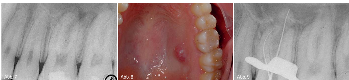
Abb. 7: Periradikuläre Läsion am 2.6. – Abb. 8: Palatinale Fistel. – Abb. 9: Feststellung der Arbeitslänge.

Nach sieben Tagen wurde der Patient erneut behandelt, um den post-endodontischen Aufbau durchzuführen. Bei der klinischen intraoralen Untersuchung wurde das Verschwinden der palatinalen Fistel deutlich (Abb. 12). Bei der Nachfolgeuntersuchung nur drei Monate nach der endodontischen Behandlung wurde die vollständige Heilung der periradikulären Wunde festgestellt (Abb. 13).