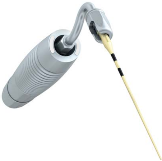
Abb. 1: Die Spitze SF65, montiert auf den Halter SF1981, der im Schallhandstück SF1LM von Komet eingesetzt ist.

Die Aufbereitung des Wurzelkanals kann sowohl mit manuellen als auch mit maschinellen Instrumenten durchgeführt werden. Beide verursachen jedoch eine Schmierschicht, welche sich entlang der Dentinoberfläche des Kanals absetzt und die Dentintubuli und Seitenkanäle verstopft und somit die vollständige Entfernung des darin enthaltenen entzündeten Materials 1 verhindert. Verschiedene Studien haben gezeigt, dass durch die Einbeziehung von Natriumhypochlorit (NaOCl) für die Desinfektion und EDTA für die Entfernung der Schmierschicht während der Aufbereitungsphase deren Wirksamkeit erhöht wird. Am Ende dieser Phase kann die Desinfektion des komplexen Kanalsystems mit Techniken verbessert werden, die eine Steigerung der Wirkung der Kanalspülmittel durch Aktivierung mit Ultraschall oder Schall und durch Spülung mit einfachen Spritzen bewirken. Einige Stu-