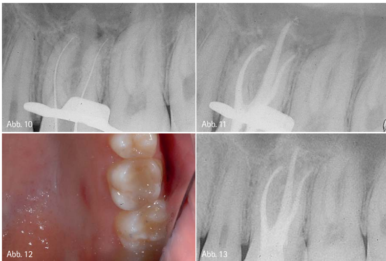
Abb. 10: Feststellung der Arbeitslänge. – Abb. 11: Obturation mit der Thermafil Technik. – Abb. 12: Die palatale Fistel ist verschwunden. – Abb. 13: Kontrolle nach drei Monaten. Vollständige Heilung der periradikulären Läsion.