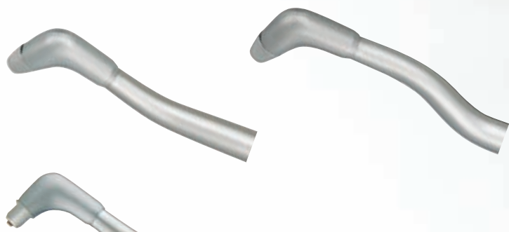
Düsen mit 60° und 80° in dem Set enthalten

Leichte, flexible Konstruktion. Das Prophy-Mate Instrument ist um 360° drehbar. Die Handstückverbindung ist so konstruiert, dass sie auch bei starkem Luftdruck frei beweglich ist. Anschließbar an alle gängigen Turbinenkupplungen.