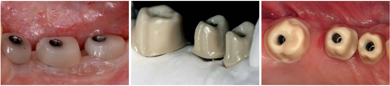
Abb. 4: Ausformung der Weichgewebe mit individuellen Heilungskapen. – Abb. 5a und b: Zweiteilige Zirkonoxidabutments mit Retentionsrillen, die mit einem Kopierschleifverfahren gefertigt wurden.