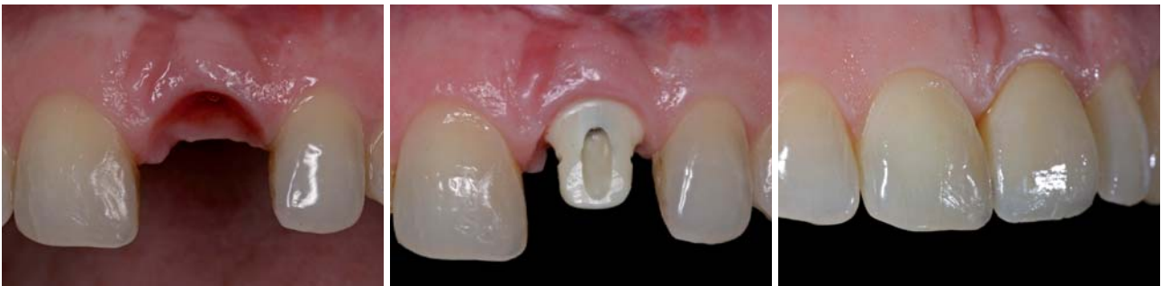
Abb. 1–3: Beispiel für eine Versorgung mit einem konfektionierten Cercon-Balance-Abutment auf einem ANKYLOS Implantat im Frontzahnbereich.

Nakamura et al. (2010) kommen in einer weiteren systematischen Übersichtsarbeit zu folgender Schlussfolgerung: Laboruntersuchungen und die Ergebnisse von klinischen Studien belegen, dass Zirkonoxidabutments für Einzelzahnversorgungen im Frontzahnbereich mit hoher Erfolgssicherheit angewendet werden. Erste klinische Ergebnisse geben zudem Hinweise darauf, dass Zirkonoxidabutments auch für Einzelkronen im Molarenbereich genutzt werden können (Canullo 2007, Zembic et al. 2009, Nothdurft et al. 2009).