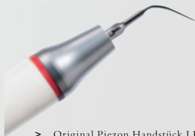
> Original Piezon Handstück LED mit EMS Swiss Instrument PS

Praktisch keine Schmerzen für den Patienten und maximale Schonung des oralen Epitheliums – grösster Patientenkomfort ist das überzeugende Plus der Original Methode Piezon, neuester Stand. Zudem punktet sie mit einzigartig glatten Zahnoberflächen. Alles zusammen ist das Ergebnis von linearen, parallel zum Zahn verlaufenden Schwingungen der Original EMS Swiss Instruments in harmonischer Abstimmung mit dem neuen Original Piezon Handstück LED.