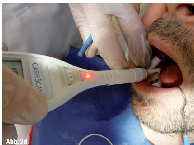
▲ Abb. 2a–d: Klinisch diagnostische Beispiele mit CarieScan PRO™: Verschiedene CarieScan PRO™ Diagnosestufen.