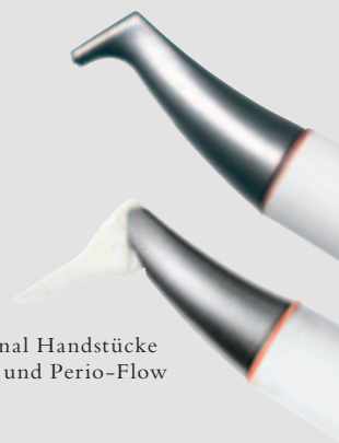
> Original Handstücke Air-Flow und Perio-Flow

Und wenn es um das klassische supra-gingivale Air-Polishing geht,