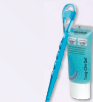
Tong-Clin Set Zungenreiniger und 50 ml Zungengel