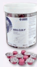
Mira-Clin P® Bewährte Prophylaxepaste

___ St. Lösung, 60 ml REF 605 655 11,50 € ___ St. Tabletten, 50er REF 605 765 9,95 €