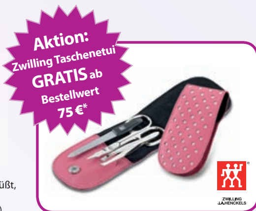
Zwilling Taschenetui beinhaltet: Nagelschere, Nagelfeile und Pinzette. Abbildung ähnlich, Etui-Farbe kann variieren!

___ St. 200 x 2 Dragees REF 635 069 19,80 €