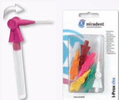
I-Prox® chx Interdentalbürste im Pocketformat

___ St. sortiert, 6er REF 630 098 2,77 €