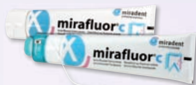
mirafleur® c 2in1 Hochwertige Aminfluoridzahncreme und Chlorhexidin-Tapezahnseide

___ St. fein (rosa) REF 630 134 4,25 € ___ St. medium (türkis) REF 630 135 4,25 €