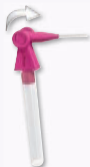
I-Prox® chx Interdentalbürste im Pocketformat

___ St. sortiert, 6er REF 630 098 2,77 €