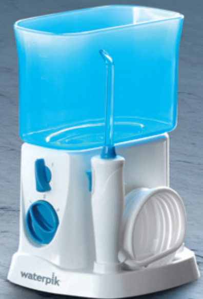
Waterpik® Reise-Munddusche Traveler WP-300E