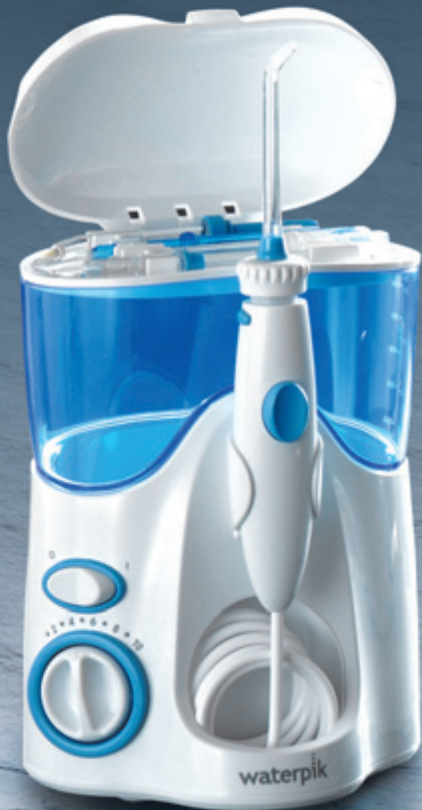
Waterpik® Munddusche Ultra Professional WP-100E4