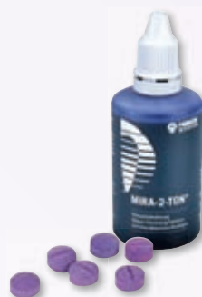
Mira-2-Ton® Plaquetest für den professionellen Gebrauch

___ St. sortiert, 6er REF 630 098 2,77 €