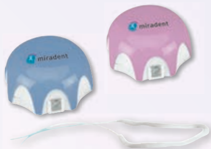
Mirafloss® Implant chx Antibakterielle Flossfäden von der Rolle

___ St. fein (rosa) REF 630 134 4,25 € ___ St. medium (türkis) REF 630 135 4,25 €