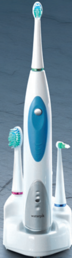
Waterpik® hydrodynamische Schallzahnbürste SENSonic Professional SR-1000E