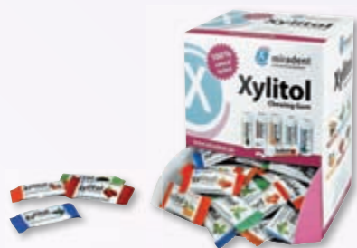
Xylitol Chewing Gum Zahnpflegekaugummi zu 100 % mit Xylitol gesüßt, in sechs Geschmacksrichtungen (Pfefferminz, Spearmint, Frucht, Zimt, Grüner Tee, Cranberry)

___ St. 50 St. mit Zahnpasta imprägniert REF 605 496 9,90 €