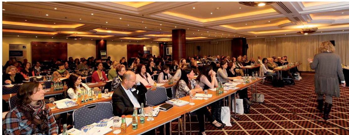
Der Kongress Zahnärztliches Personal war 2010 gut besucht.

Die reine zahnmedizinische Behandlung ist für den Patienten nicht das einzige Kriterium für die Bewertung einer Zahnarztpraxis. Der richtige Mix aus Ansprache, Service, Beratung und