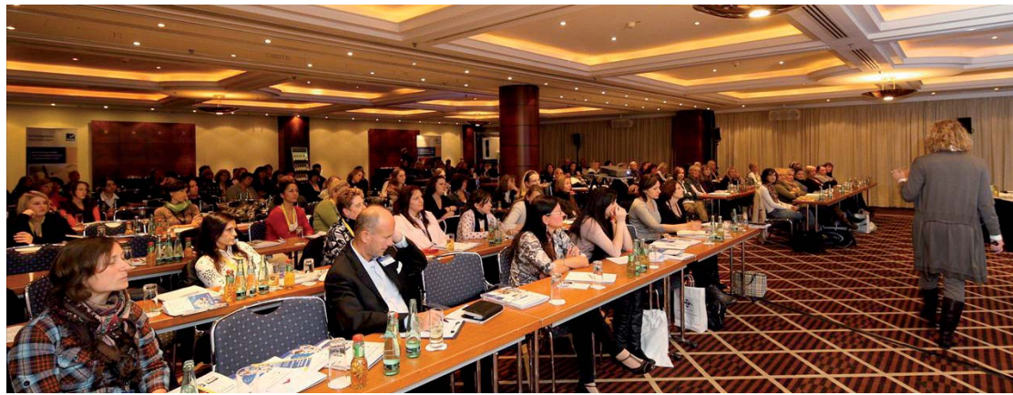
Der Kongress Zahnärztliches Personal war 2010 gut besucht.

Die reine zahnmedizinische Behandlung ist für den Patienten nicht das einzige Kriterium für die Bewertung einer Zahnarztpraxis. Der richtige Mix aus Ansprache, Service, Beratung und