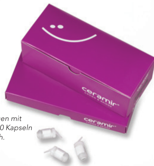
Packungen mit 5 oder 20 Kapseln erhältlich.

ceramir® CROWN & BRIDGE by Doxa www.ceramir.de