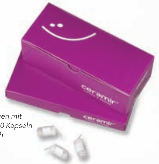
Packungen mit 5 oder 20 Kapseln erhältlich.

ceramir® CROWN & BRIDGE by Doxa www.ceramir.de