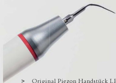
> Original Piezon Handstück LED mit EMS Swiss Instrument PS

Praktisch keine Schmerzen für den Patienten und maximale Schonung des oralen Epitheliums – grösster Patientenkomfort ist das überzeugende Plus der Original Methode Piezon, neuester Stand. Zudem punktet sie mit einzigartig glatten Zahnoberflächen. Alles zusammen ist das Ergebnis von linearen, parallel zum Zahn verlaufenden Schwingungen der Original EMS Swiss Instruments in harmonischer Abstimmung mit dem neuen Original Piezon Handstück LED.