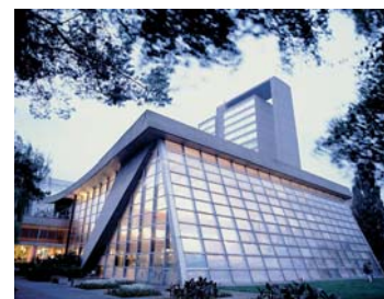
Der Tagungsort: das Kongresshaus CTS in Biel.

Der ITI Congress Schweiz ist einer von zahlreichen nationalen ITI Kongressen, die jährlich weltweit