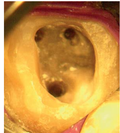
Abb. 3: Wurzelkanäle im OP-Mikroskop aufbereitet und dargestellt.

Endodontieversager entstehen meistens durch bakterielle Infektionen mit gramnegativen Anaerobier. Es ist bekannt, dass das Problem der Wurzel-