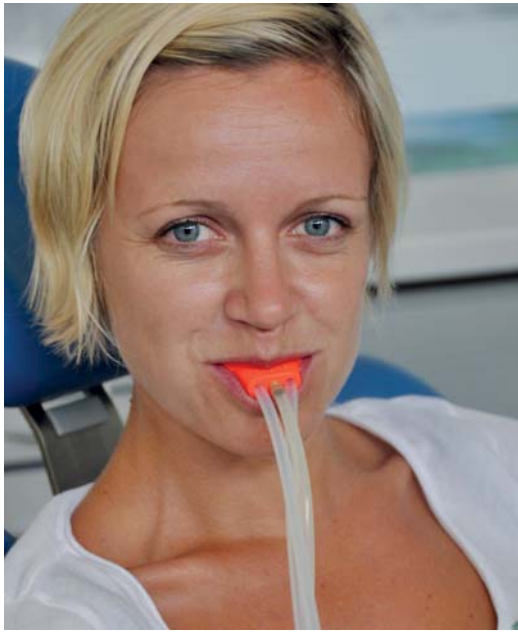
Abb. 1: Patientin mit dem individuellen Löffel bei Beflutung mit Ozon.

antibiotikainduzierten Immunsuppression besteht nicht in der Therapiezeit selbst, sondern in den resultierenden Abwehrparalysen danach.