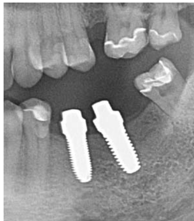
Abb. 2: Keramikkimplantate.

Die Anwendung mit einem individuellen Löffel führen wir zur Minderung der anaeroben Keime im Mund vor jeder Implantation routinemäßig durch. Die Methodik und Indikation ist vergleichbar mit der Parodontalbehand-