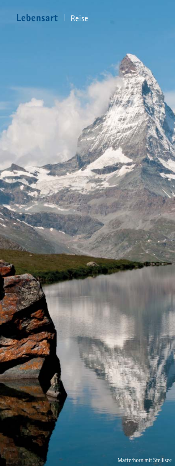
Matterhorn mit Stellisee