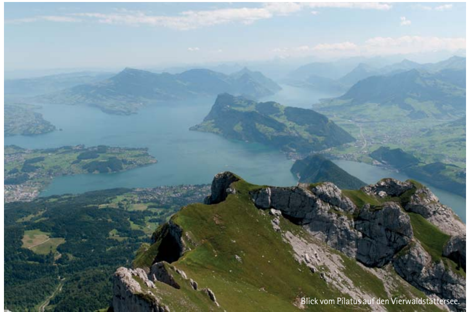
Blick vom Pilatus auf den Vierwaldstättersee.

Von Zermatt hatten wir schon viel gehört: Der bekannte autofreie Ferienort liegt am Fuße des Matterhorns und zieht jedes Jahr Tausende Touristen aus der ganzen Welt an. Auch wir wurden nicht enttäuscht und wurden – nachdem wir wie alle vom „Vorort“ Täsch mit dem Zug angereist sind – gleich in den angenehmen Trubel Zermatts hineingezogen. Obwohl das typische Bild eines Walliser Bergdorfs nur noch im Ortskern wiederzufinden ist, blieb der Ort vor größeren Bausünden verschont. Holzhäuser mit blumengeschmückten Balkons, kleine Elektroautos, Pferdewagen und Souvenirshops bestim-