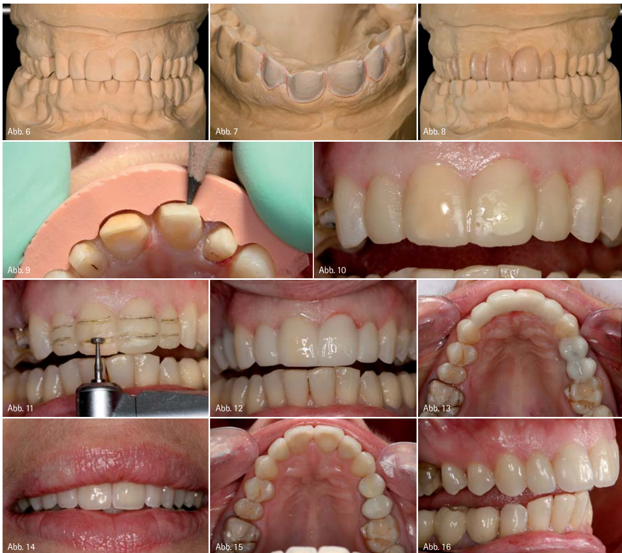
Abb. 6: Im Modell erfolgt die Planungspräparation für die Herstellung des Wax-up. – Abb. 7: Mit Silikonwällen wird die Form des Wax-up fixiert und für die Übertragung in die Mundhöhle vorbereitet. – Abb. 8: Wax-up in cremefarbenem Modellierwachs für eine harmonische Ästhetikplanung. Hier werden nicht nur ästhetische Belange, sondern auch das funktionelle Design geplant. – Abb. 9: Kontrolle der Zahnpräparation mit einem Silikonwall, der anhand des Wax-up angefertigt wurde. Präparation der Zahnstümpfe mit vollständiger Entfernung aller organischen Füllungsanteile. Das interne Bleaching des wurzelkanalgefüllten Zahnes 11 erfolgt im Laufe der Behandlungssitzung. – Abb. 10: Übersetzung der Wax-up-Planung in die Mundhöhle, vor der Zahnpräparation. – Abb. 11: Definierte horizontale Tiefenpräparation (0,3mm) mit einem diamantierten Walzenschleifkörper. – Abb. 12 und 13: Mit einem ästhetisch und funktionell geplantem Mock-up-Provisorium verlässt die Patientin die Praxis. – Abb. 14 und 15: Die 360° Veneers mit Glasbasis integrieren sich natürlich und harmonisch in die vorhandene Zahnreihe. – Abb. 16: In der rechten Seitenansicht sind an 15, mittels Glasbasiskrone auf eigenem Zahn an 14, mittels Glasbasiskrone auf einem Implantat sowie an 12, 11, 21, 22, die 360° Veneers mittels Glasbasis dargestellt.

exakt nach prothetischen Gesichtspunkten umgesetzt werden konnte. Speziell die ästhetische Rekonstruktion von Frontzähnen bedarf einer exakten Vorausplanung, bei der nach prothetischen Gesichtspunkten kontrolliert die Zähne präpariert werden.