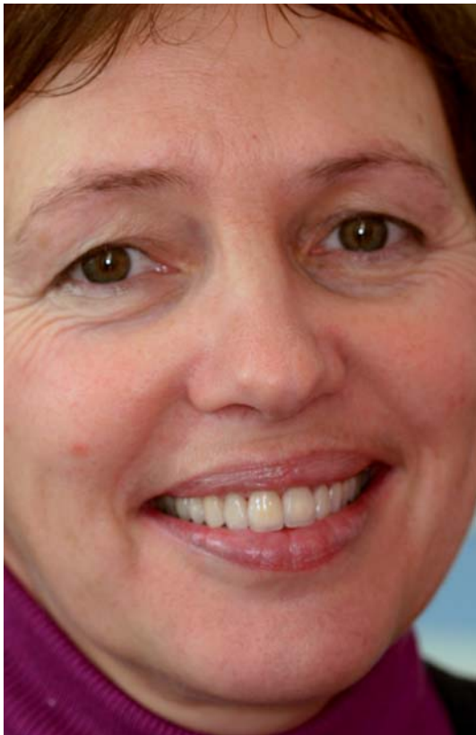
Abb. 17: Den ästhetischen Erfolg der Behandlung honoriert die Patientin, mit ihrem kristallklaren Lächeln.

Glaskäppchen ein neues Zeitalter. Im vorliegenden Fall konnte durch individuelle prothetische Planung sowie eines ästhetisch-funktionellen Wax-up für die Patientin ein natürliches Aussehen erreicht werden. Durch das harmonische Lächeln unserer Patienten werden wir gerne daran erinnert: „Ein Lächeln ist das Zweitbeste, das wir mit unseren Lippen tun können.“