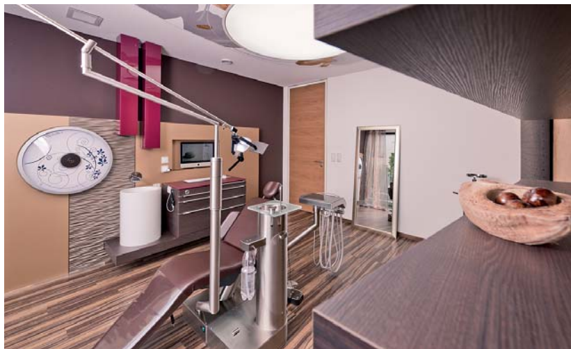
Bis ins kleinste Detail: Zusammen mit der Fa. DKL (Rosdorf) entwickelte individuelle Prophylaxeeinheiten.

wir entwerfen raumkonzepte und fertigen einrichtungen – auf ihre wünsche und ihr budget abgestimmt.