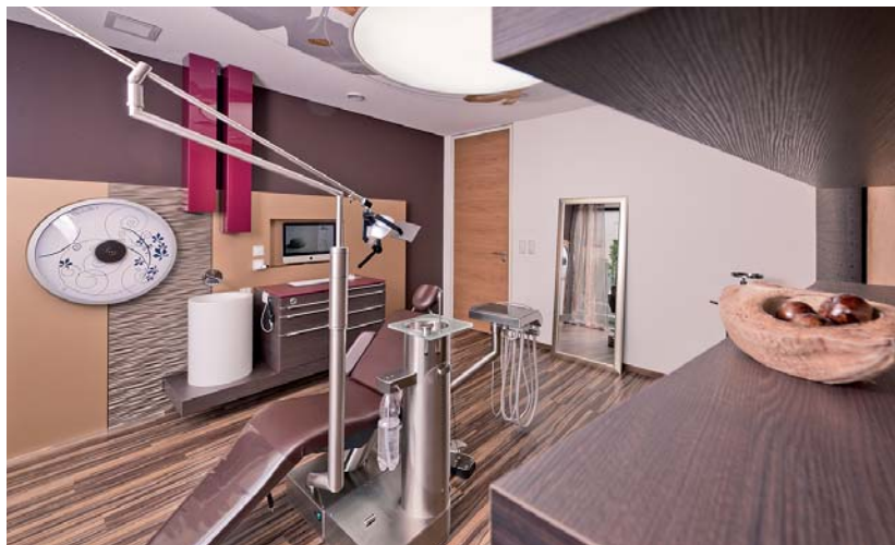
Bis ins kleinste Detail: Zusammen mit der Fa. DKL (Rosdorf) entwickelte individuelle Prophylaxeeinheiten.