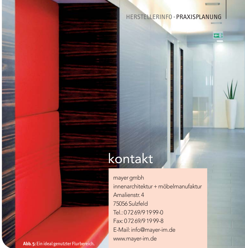
Abb. 5: Ein ideal genutzter Flurbereich.

Werden all diese Punkte berücksichtigt und umgesetzt, steht einem erfolgreichen Praxis-konzept nichts mehr im Wege. ◀