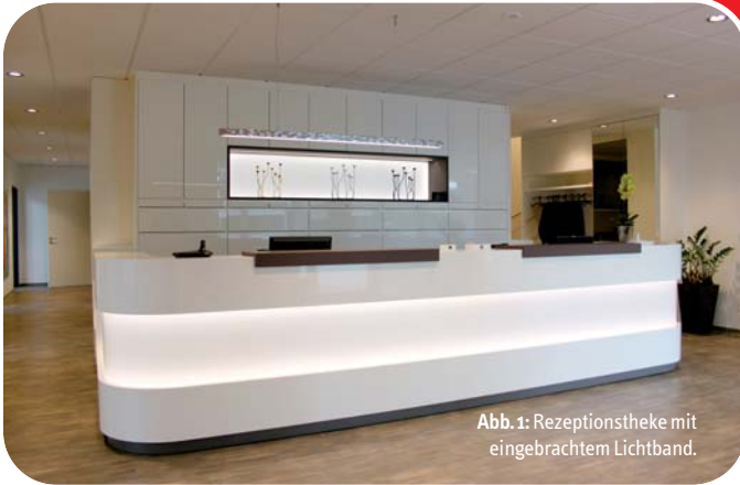
Abb. 1: Rezeptionstheke mit eingebrachtem Lichtband.

Auch für eine Praxis ist das Leitmotiv „Der Kunde steht im Mittelpunkt“ von großer Bedeutung: Der Patient wird immer mehr als Kunde gesehen, die Praxisatmosphäre soll einladen und nicht an eine Klinik erinnern. Der Grundgedanke dabei: Es geht um Gesundheit, nicht um Krankheit! Der Patient soll sich also in einer angstfreien und einladenden Atmosphäre wohlfühlen.