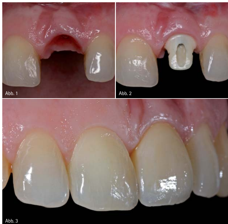
Abb. 1–3: Beispiel für eine Versorgung mit einem konfektionierten Cercon-Balance-Abutment auf einem ANKYLOS Implantat im Frontzahnbereich.

B eim metallischen Abutment-Typ war eine Lockerung der Abutmentschraube das am häufigsten festgestellte technische Problem, Frakturen des Implantatabutments traten nur selten auf (Pjetursson et al. 2007). Allerdings liegt ein großer Nachteil der Metallabutments in ihrer grauen Farbe. Eine potenzielle ästhetische Beeinträchtigung liegt in einer Verfärbung der periimplantären Mukosa. Aus diesem Grund ist der Einsatz dieser Abutments trotz ihrer Stabilität in ästhetisch anspruchsvollen Bereichen bei einer dünnen periimplantären Mukosa nicht optimal (Sailer et al. 2009). Als Alternative wurden keramische Abutments entwickelt, die zunächst aus hochstabilem Aluminiumoxid bestanden (Prestitino und Ingber 1993, Wohlwend et al. 1996). Später wurden auch Abutments aus Zirkonoxid hergestellt. Diese Keramikabutments bieten im Vergleich zu metallischen Abutments mehrere Vorteile in der klinischen Anwendung. Zum einen ist ihre hochwertige Ästhetik nachhaltig dokumentiert – Keramikabutments verursachen signifikant weniger mukosale Verfärbungen als Metallabutments. Zum anderen wurden auf keramischen Materialien wie Aluminiumoxid und Zirkonoxid deutlich geringere Ablagerungen von Bakterien festgestellt als auf Titanabutments. Darüber hinaus ist die Weichgewebsintegration bei den keramischen Werkstoffen Alu-