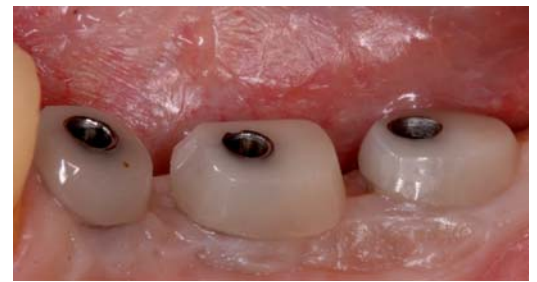
Abb. 4: Ausformung der Weichgewebe mit individuellen Heilungskappen.

Konfektionierte Zirkonoxidabutments werden bereits seit mehreren Jahren klinisch angewendet. Die grundlegenden klinischen Arbeitsschritte der Abformung und Eingliederung unterschei-