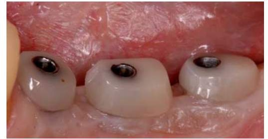
Abb. 4: Ausformung der Weichgewebe mit individuellen Heilungskappen.

Konfektionierte Zirkonoxidabutments werden bereits seit mehreren Jahren klinisch angewendet. Die grundlegenden klinischen Arbeitsschritte der Abformung und Eingliederung unterschei-